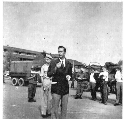
Hptm. Seiterle (in Zivil) beim Uebersetzen und Präzisieren der Ausführungen des hinter ihm stehenden Kdt. des «Honest-John»-Bataillons. Dieser, ein Oberstlt. und Generalstabsobf., muß, ähnlich wie bei uns, nebst seiner Tätigkeit als Stabsobf. sich auch über eine gewisse Zeit als Truppenoffizier bewähren.