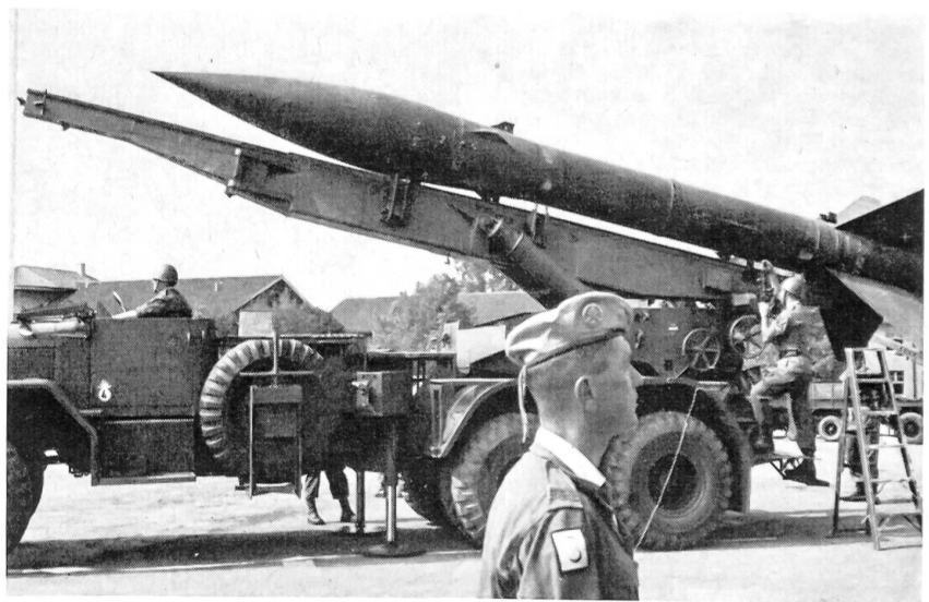
Der Abschlußwagen ist in Stellung, und nun wird die Rakete in den berechneten Abschlußwinkel gebracht.