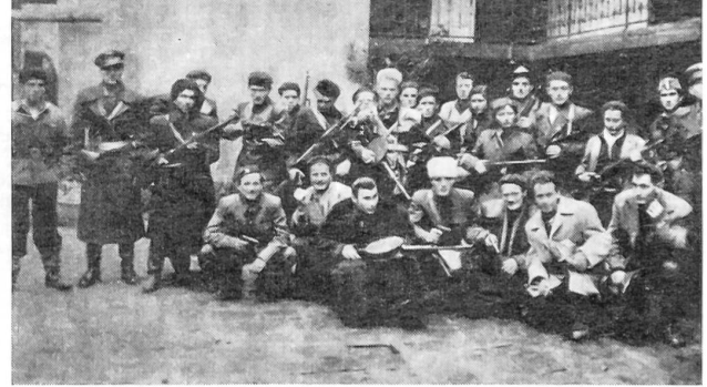
Eine Gruppe der Aufständischen des Corvin-Blocks. Zu beachten sind die zahlreichen Militärpersonen unter den Zivilisten!