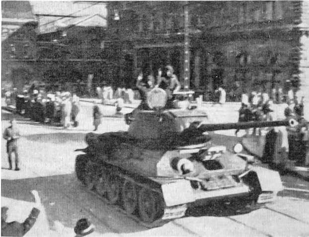
Die Bevölkerung von Budapest begrüßt herzlich die ungarischen Panzer, die sich auf die Seite der Revolutionäre gestellt haben (30. Oktober).