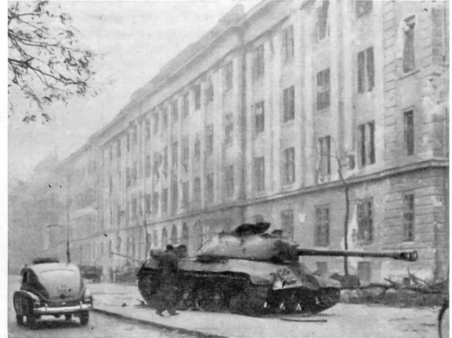
Das Hauptportal der Kilian Kaserne nach dem Sieg der Revolution (31. Oktober 1956). Im Vordergrund ein vernichteter russischer Panzer.