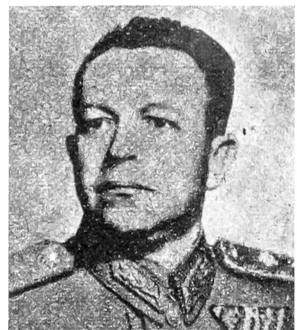
Verteidigungsminister István Bata (General- oberst)