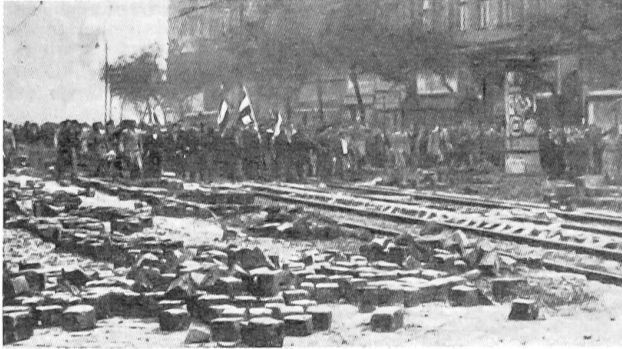
Demonstrationszug am 24. Oktober in Budapest

kompromittierter General: Generalleutnant Janza. Daß dieser sehr gute Beziehungen zu den Sowjets unterhielt, wußte man zur Zeit nicht. Janza konnte sich gut tarnen, und während er sich als Anhänger von Nagy ausgab, half er mit allen Mitteln der Moskowitergruppe im Ministerium, ihr schädliches Werk auszuüben. Dies bestand darin, das Chaos – jetzt, wo die Revolution zu siegen schien – in der ganzen Armee zu vermehren und somit zu vereiteln, daß sich eine neue, patriotische Armee organisierte. Obwohl am 29. Oktober die Russen Budapest verlassen mußten und auch versprochen, ganz Ungarn militärisch zu räumen, vermehrten sich die Meldungen aus dem Osten des Landes, die von neuen sowjetischen Truppenbewegungen