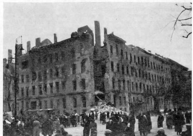
Die völlig ausgebrannte Kilian Kaserne nach der zweiten sowjetischen Militärintervention in Budapest.