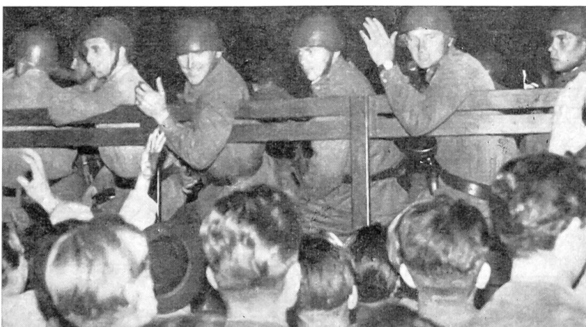
Fraternisierung der ungarischen Armee mit der Bevölkerung (23. Oktober 1956, Spät- abend)