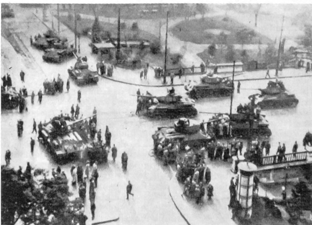
Die Panzer des 33. Pz.Rgt. der ungarischen Volksarmee blockieren am 24. Oktober die Margarethen-Brücke. Die Bevölkerung unterhält sich mit den Soldaten.