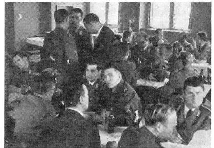
Nun gilt es, die Resultate vom Wettkampf zu besprechen.