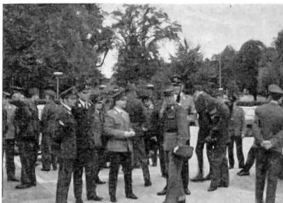
Ankunft der deutschen Kameraden in Schaffhausen

Anschließend an diese Konkurrenz gelangten die Filme «Einer von Allen» sowie «Defilee in Dübendorf» zur Aufführung. Mit letzterem wurde beabsichtigt, den deutschen Gästen einen Querschnitt über die Bewaffnung unserer Armee zu vermitteln.