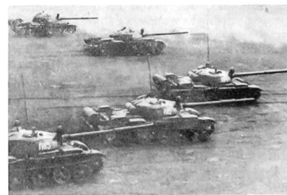
Aus der Tiefe des rückwärtigen Raumes stießen sowjetische Panzerspitzen hervor Typ T-55

Verlagsgenossenschaft «Schweizer Soldat»