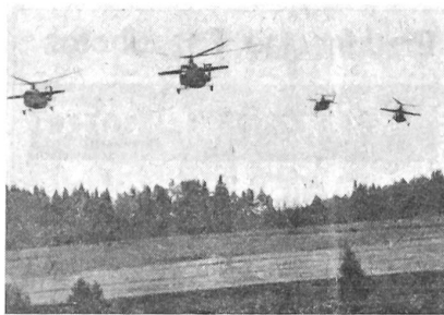
Hubschrauberangriff in Südböhmen

komplizierten Bedingungen in den Kampf einzugreifen.