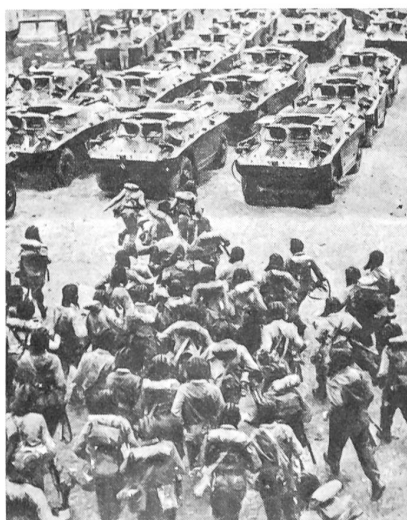
Ungarische Mot.-Schützen vor dem Einsatz

Die sowjetischen Großraumtransporter des Typs AN-12 flogen Welle um Welle tschechoslowakische Fallschirmjäger, Luftlandepanzer, Granatwerfer und Geschütze heran und setzten sie in den vorgesehenen Planquadraten ab. Schon zu Beginn der Manöver fiel den Raketen-einheiten die wichtige Rolle zu, unter