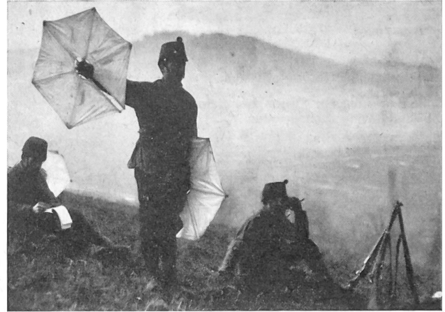
Wo im Manöver Telefonleitungen von den Telefonpatrouillen in nützlicher Zeit nicht verlegt werden konnten und Radfahrer und Meldereiter nicht verwendbar waren, traten bei günstiger Witterung die Signalpioniere in Aktion.