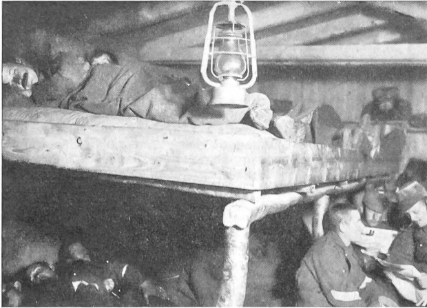
Schlafstätte in der Blockhütte eines Offizierspostens in der Ajoie. So schliefen unsere Soldaten auf den Grenzposten vier Jahre lang in ständiger Alarmbereitschaft auf Strohsäcken, eingepuppt in die Kleider, die schweren Marschschuhe an den Füßen, die Waffen oft umgehängt oder in greifbarer Nähe, während draußen in zweistündiger Ablösung der Posten scharfe Wache hielt.