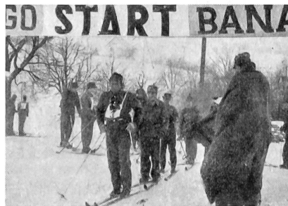
Am Start zum Patrouillenlauf

Der Unteroffiziersverein Baselland führt seit dem Jahre 1947 bei günstigen Schneeverhältnissen im Baseltaler Jura Militär-Skiwettkämpfe durch, die jeweils einen Ski-Einzellauf mit Handgranatenwerfen und Schießen, einen Patrouillenlauf mit Schießen und einen Riesenslalom umfassen. Anlaß zu diesen Wettkämpfen gaben die «Weißen SUT» 1946 in Davos. Daran beteiligte sich auch eine starke Patrouille des UOV Baselland, die sich im Partouillenlauf im ersten Range zu plazieren vermochte. Angesporn durch den Patrouillensieg wurde auf der Heimfahrt der Gedanke erwogen, eigene regionale Militär-Skiwettkämpfe zu organisieren. Nach eingehender Beratung war man sich einig: Ab 1947 werden jeweils alljährlich im verkehrstechnisch günstig gelegenen Läuelfingen am unteren Hauenstein Militär-Skiwettkämpfe durchgeführt. Wir müssen heute gestehen, die Wahl des Austragungsortes war nicht schlecht. Nicht schlecht deswegen, weil dort ein Gelände vorhanden ist, das jeder Anforderung gerecht wird, und weil in Läuelfingen und Umgebung ein Völklein wohnt, das die außerdienstliche Tätigkeit unserer Wehrmänner zu schätzen weiß und jeweils recht zahlreich die Wettkämpfe verfolgt.