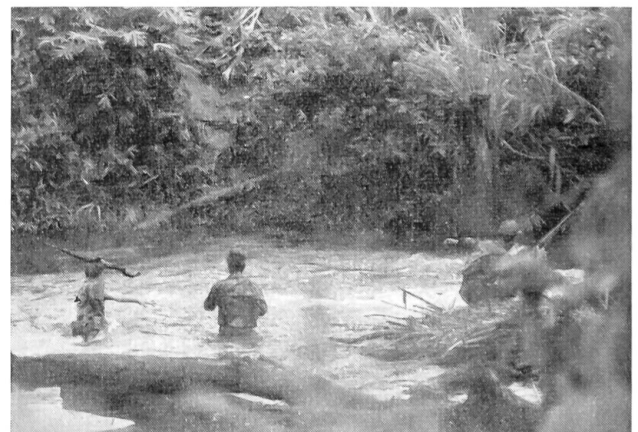
Im Vietcong-Gebiet: Eine Vorhut von Montagnards fühlt sich an das andere Bachufer hinüber. Wenn sie den Pfad (Mitte) gesichert hat, folgt die Patrouille, einer nach dem andern, nach.