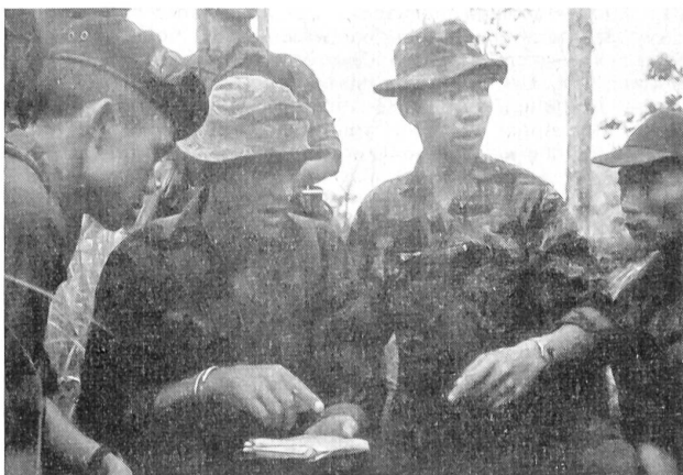
Self erteilt durch seinen Dolmetscher Instruktionen an Sicherheitsposten während einer Rast. Vietnamesischer Berater der Spezialtruppe schaut zu.