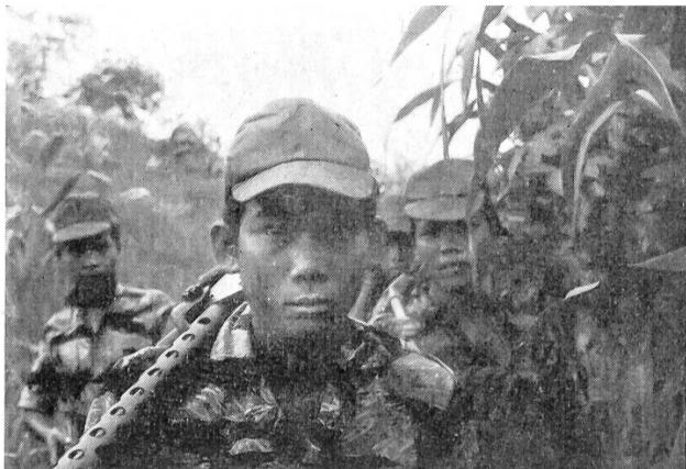
Ein amerikanischer Berater sagt über diese von ihnen ausgebildeten und bewaffneten Montagnards (hier auf Patrouille): «Innert 10 Jahren werden sie Vietnam aufbauen oder zerstören.»