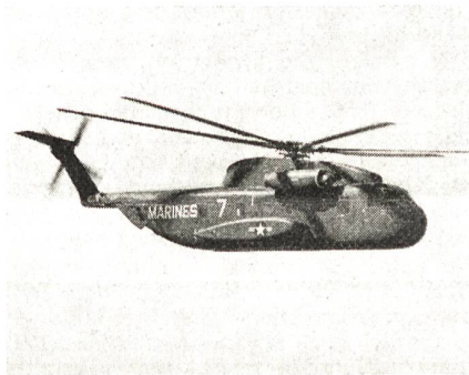
Sikorsky CH-53, der schwere Kampfhubschrauber.

für Serien-Helikopter der westlichen Welt hat Lt Col R. Guay mit einem Sikorsky CH-53 des US Marine-Corps aufgestellt. Der Hubschrauber beförderte bei einem Testflug eine Nutzlast von 12 900 kg. Das Gesamtgewicht der CH-53 erreichte 23 400 kg. Nach Angaben der Piloten wurden Geschwindigkeiten bis 220 km/h erfliegen. Das US Marine-Corps setzt die CH-53 für schwere Truppen- und Materialtransporte, die US Air Force für Rettungs- und Bergungsaufgaben auf dem südvietnamesischen Kriegsschauplatz ein.