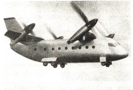
Modell des projektierten deutschen VTOL-Transporters VC 400 in der Transitionsphase.

des deutschen VTOL-Transporters VC 400 macht Fortschritte. Die Vereinigten Flugtechnischen Werke (VFW) gaben bekannt, daß mit der Fertigung von Propellern und Getrieben begonnen wird. Sie werden Teil eines Prüfstandes für Antriebssysteme sein, der vorerst stationär, später jedoch als Schwebegestell flugfähig gemacht wird. Die VC 400 ist eine senkrechtstartende militärische Transportmaschine mit schwenkbaren Flügeln und vier Turbo-prop-Triebwerken. Das Prinzip des Hubschraubers wird bei diesem Flugzeug mit den Vorteilen eines konventionellen Flugzeuges kombiniert, indem die Rotoren auf den Tragflächen schwenkbar angebracht sind. Im Reiseflug soll die VC 400 daher auch Geschwindigkeiten bis 750 km/h erreichen. PHHA