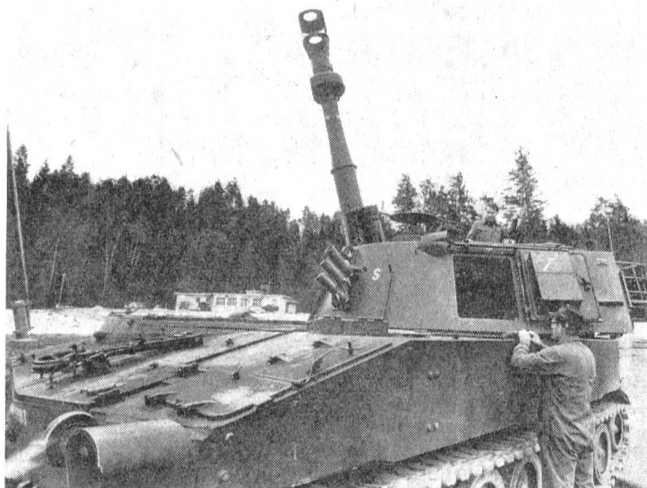
Die Panzerhaubitze M-109, mit welcher die Schlagkraft unserer Armee stark erhöht werden kann. Deutlich sind die groß dimensionierte Mündungsbremse und der Rauchabzug zu erkennen.