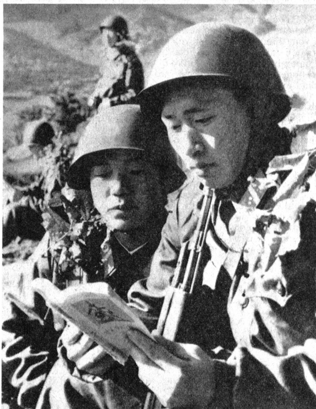
Auch während der Manöver und in wirklichkeitsnahen Übungen finden nordkoreanische Soldaten Zeit genug (d. h. sie müssen genug Zeit finden!), sich durch die Lektüre kommunistischer Literatur ideologisch aufzurüsten