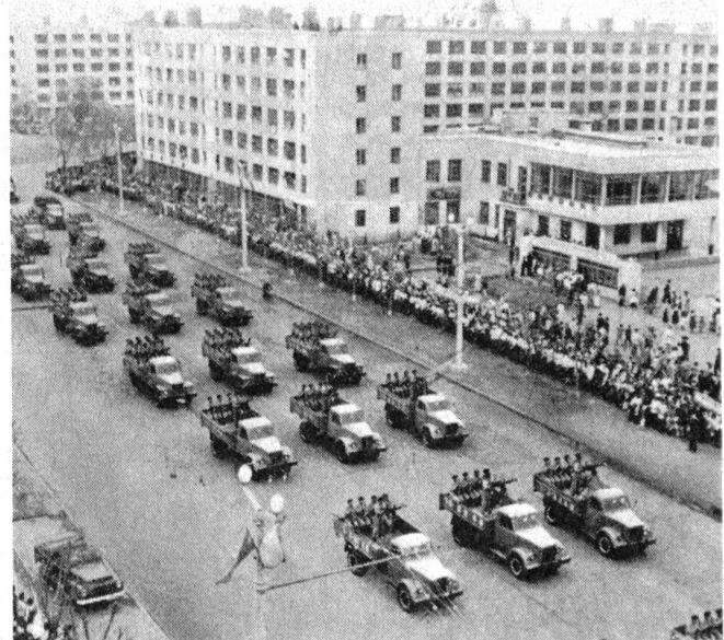
Parade der nordkoreanischen Armee in Pyongyang