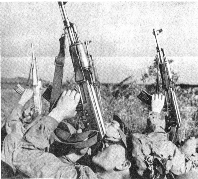
Nordkoreanische Soldaten bei Schießübungen gegen Flugzeuge