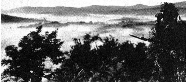
Nordkoreanische Soldaten an der Demarkationslinie

Vor kurzem veröffentlichten wir einen Bildbericht über die starke südkoreanische Armee. Heute präsentieren wir unseren Lesern einige Bilder nordkoreanischer Soldaten, deren Ausbildung und deren Ausrüstung jener der südkoreanischen Streitkräfte ebenbürtig sind. Nordkoreaner und Südkoreaner sind Angehörige des gleichen Volkes, der gleichen Nation sogar. Wie in Deutschland und wie in Vietnam, hat kommunistischer Herrschaftsanspruch auch Korea durch eine unsinnige Grenzziehung in zwei unüberbrückbare Welten geteilt. In bitterem Haß stehen sich die beiden Armeen gegenüber, und es braucht nur den berühmten Funken ins Pulverfaß, um das leidgeprüfte koreanische Volk beidseits der künstlichen Grenze, wie 1950, neuerdings in einen Krieg zu stürzen. —g.