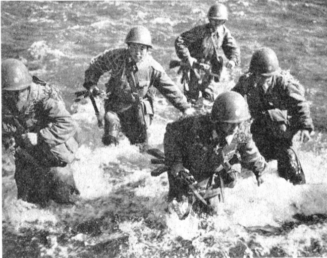
Nordkoreanische Soldaten beim Durchwaten eines Flusses