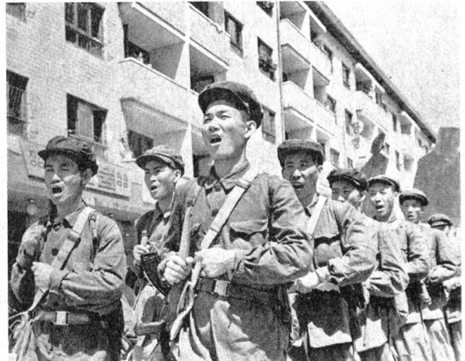
Angehörige nordkoreanischer Milizformationen (Werkschutzeinheiten)