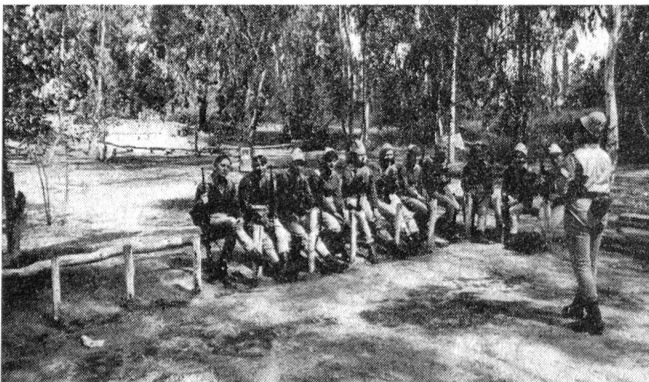
Weibliche Offiziere und Unteroffiziere besorgen auch die Ausbildung der Rekrutinnen an den Waffen.

ZAHAL's Soldatinnen stehen in Israel in großem Ansehen. Ihre überdurchschnittlichen Leistungen haben wesentlich zum raschen und entscheidenden Sieg über die arabischen Armeen beigetragen.