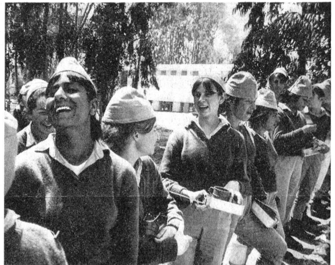
Zum Fassen angetreten. Trotz der Härte des Dienstes ist die Moral der Mädchen hoch und ihr Humor bricht immer wieder durch.