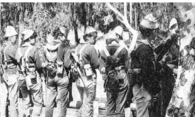
In Israel wissen die uniformierten Mädchen mit Maschinenpistolen und Sturmgewehren genau so gut zu schießen und zu treffen wie ihre männlichen Kameraden.