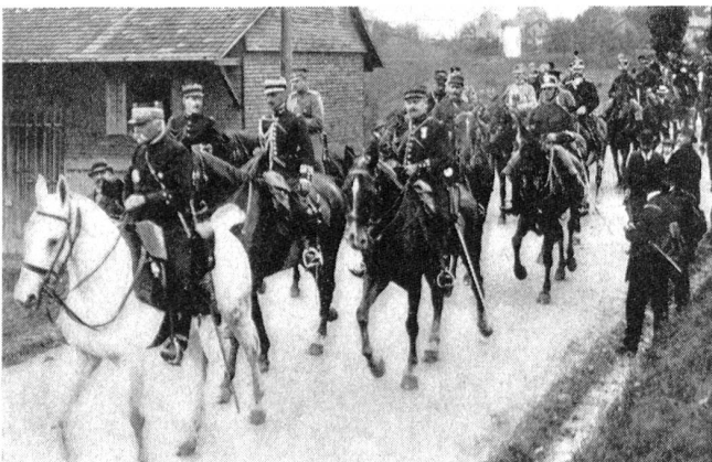
Die fremden Offiziere, die den Manövern folgten, in schweizerischer Kavalleriebegleitung unterwegs im Operationsgebiet. Nicht weniger als 39 Offiziere aus 18 Staaten waren zu diesen Kaiseranlässen delegiert worden. Frankreich entsandte den einarmigen Helden aus dem Kriege 1870/71, General Paul (an der Spitze reitend), England den früheren Buren general Beyer, Oesterreich den Feldmarschall Dankl.