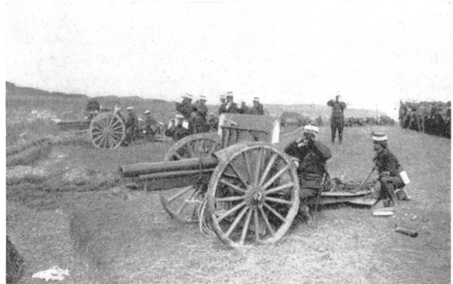
Feldbatterie der roten 6. Manöverdivision in Stellung auf den südlich Kirchberg gelegenen Hügeln von Häuslig.