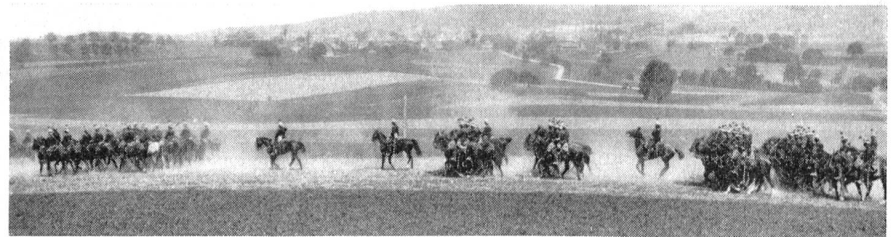
Aufmarsch der Kavallerie nach Abschluß der Manöver am 6. September zum großen Defilee auf der Ebene von Aadorf. Mehr als 100 000 Schaulustige wohnten dem Vorbeimarsch bei.