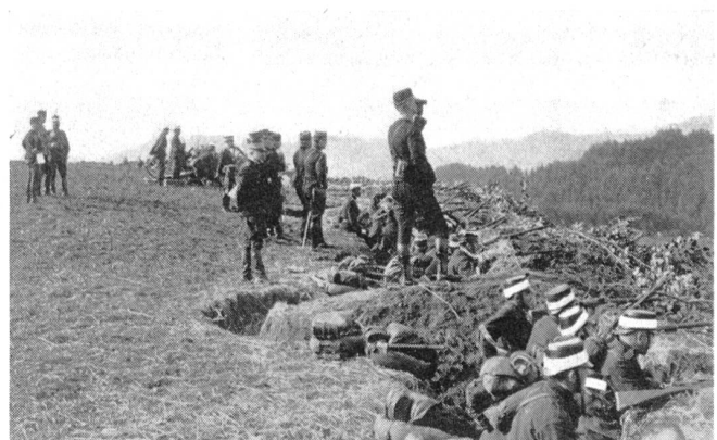
Auf der Höhenterrasse Kirchberg—Gähwil eingegrabene Infanterie der 6. Division in Erwartung des Generalangriffs der blauen 5. Division.