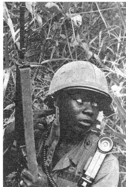
Farbige GIs in Vietnam: Wegen mangelnder Bildung ...

25, «sieht man dich an und sagt: Der ist Neger. Hier in den Streitkräften zählt nur die Leistung.»