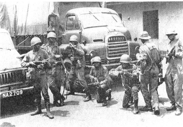
Bundestruppen der Regierung von Lagos