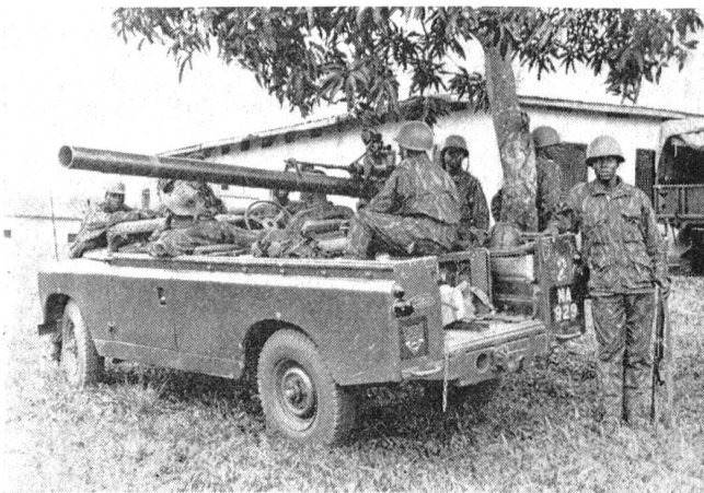
Ein mit einem 105 mm Raketen-Rohr bestückter Landrover der Bundestruppen

Bei genauer Betrachtung sind die Unruhen, die Afrika aufzuwühlen scheinen, in den meisten Fällen doch Auseinandersetzungen zwischen Stämmen oder Rassengruppen, die seinerzeit durch die Anwesenheit von Kolonialmächten verunmöglicht worden waren. Seit 1960 von der britischen Herrschaft befreit und unabhängig wurden, haben die Ibos, Haoussas, Yorubas und andere Tivs, die bis heute den Bundesstaat Nigeria bildeten, nie aufgehört, ihre eigenen Charakteristiken zu verteidigen. Die Rebellion wird wohl solange dauern, bis dieser am stärksten bevölkerte Staat Afrikas zu dem zurückkehren wird, was er nie zu sein aufgehört hat: kleine Staaten in den Dimensionen der einzelnen Stämme.