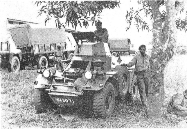
Leichter Panhard-Panzer in Okitupupa