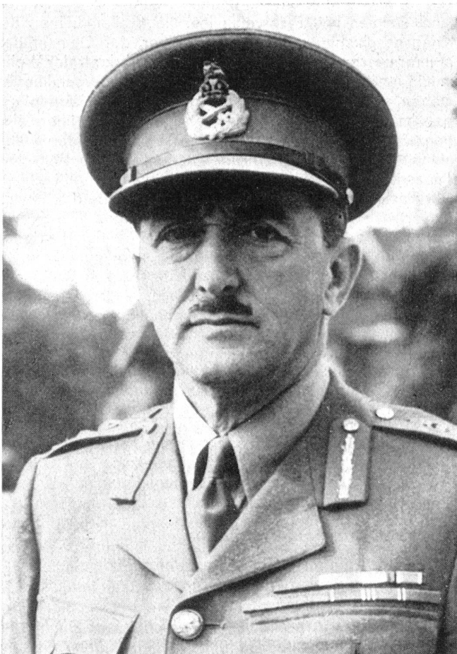
Feldmarschall Sir Alanbrooke.

Die Ursachen der überlegenen Kampfmoral der deutschen Wehrmacht erkennt der Biograph des britischen Feldmarschalls Lord Alanbrooke, Arthur Bryant, in der damaligen psychologischen Situation des französischen Volkes: