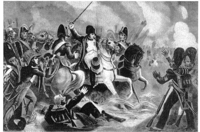
Napoleon in der Schlacht von Waterloo (Belle-Alliance).

Bei Waterloo wird Napoleon von Wellington und Blücher endgültig besiegt. Am Abend des 18. Juni 1815 löst sich die französische Armee in wilder Panik auf. Vergeblich werfen sich die Marschälle Ney und d'Erlon der fliehenden Masse von Soldaten entgegen und versuchen, sie zum Halten und zum Kämpfen zu bringen. Vergeblich ihr persönlicher Einsatz, kein Offizier hört mehr ihre Befehle,