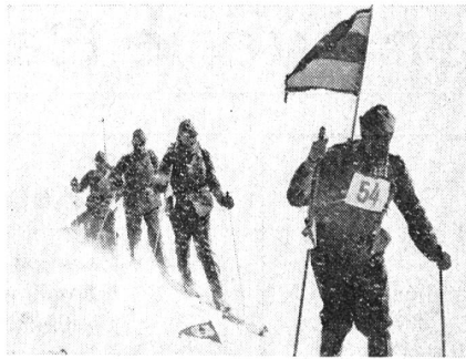
Patrouille des UOV Zug auf der sturmgepeitschten Höhe des Gandlauenengrattes, auf über 2000 m Höhe.