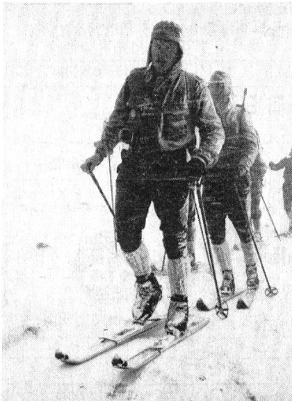
Eine Gruppe der Gebirgsjäger aus Mittenwald, Vertreter der 1. Deutschen Gebirgsdivision, die immer wieder nach dem Obersimmental kommen.

für die gute Organisation, die sich schon mehrmals schwierigsten Anforderungen gewachsen zeigte, Anerkennung über die Landesgrenzen hinaus gefunden. Unsere Bilder sollen allen Interessenten einen Eindruck der geforderten Leistung vermitteln.