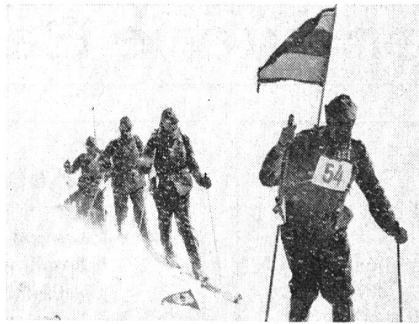
Patrouille des UOV Zug auf der sturmgepeitschten Höhe des Gandlauenengrattes, auf über 2000 m Höhe.