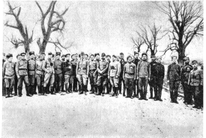
Die Fraternalisierung ungarischer und russischer Soldaten an der Ostfront 1917.

Auch auf aussenpolitischer Ebene erlitt die Károlyische Politik einen Schiffbruch. Die Westmächte, voran die Franzosen, betrachteten Ungarn als Nachfolger der Donau-Monarchie, wobei der Oberbefehlshaber der französischen Truppen auf dem Balkan, General Franchet d'Espérey, den bei ihm in Belgrad erscheinenden Károlyi trotz dessen Unterwürfigkeit ablehnend und barsch behandelte. Inzwischen gerieten auch die Grenzen Gross-Ungarns ins Wanken. Nach den Kroaten sagten sich die Siebenbürger Rumänen, danach die Slowaken von Budapest los. Vergebens waren die enormen Bemühungen der Emissäre der Károlyi-Regierung — weder der eine noch der andere konnte die Nationen zu einem anderen Entschluss als zur Loslösung von Budapest bewegen. Die Armee zerfiel. Und wer unter den Soldaten noch für das Land kämpfen wollte, wurde von Károlyis Kriegsminister,