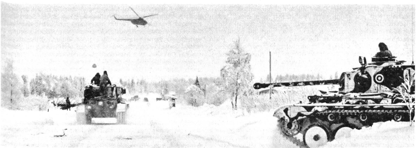
Unten: Die finnischen Streitkräfte verfügen über kleine, aber schlagkräftige Panzereinheiten. Besonderer Wert wird auf das reibungslose Zusammenwirken von Infanterie, Panzern und Luftaufklärung gelegt.