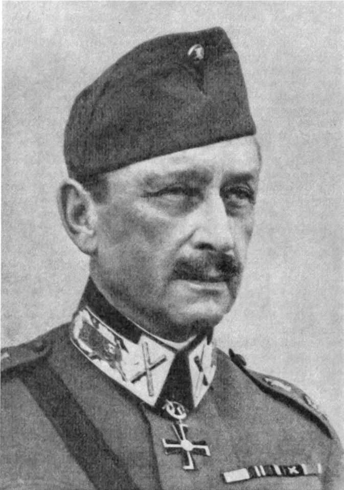
Marschall Mannerheim, Oberbefehlshaber der finnischen Armee 1939 und 1941—1944

zur Verfügung standen, setzten sich aus unzureichend ausgebildeten, oft nur mit Sensen und Heugabeln bewaffneten Freiheitskämpfern der regierungstreuen Bürgerwehren zusammen. Die in Deutschland geschulten finnischen Jäger, alles Angehörige des aufgelösten Jägerbataillons 27, trafen vom 25. Februar an in Vaasa ein. Sie bildeten Kern und Elite der «weissen» Streitkräfte. Bald liefen auch die ersten im Rahmen des deutsch-finnischen Hilfsabkommens vereinbarten Waffenlieferungen an. Frachter und U-Boote löschten im Schutze der Schären grosse Mengen dringend benötigten Kriegsmaterials, u. a. 40 000 Gewehre, 70 MG, 4 Kanonen, 4 Tonnen Sprengstoff und eine Funkstation.