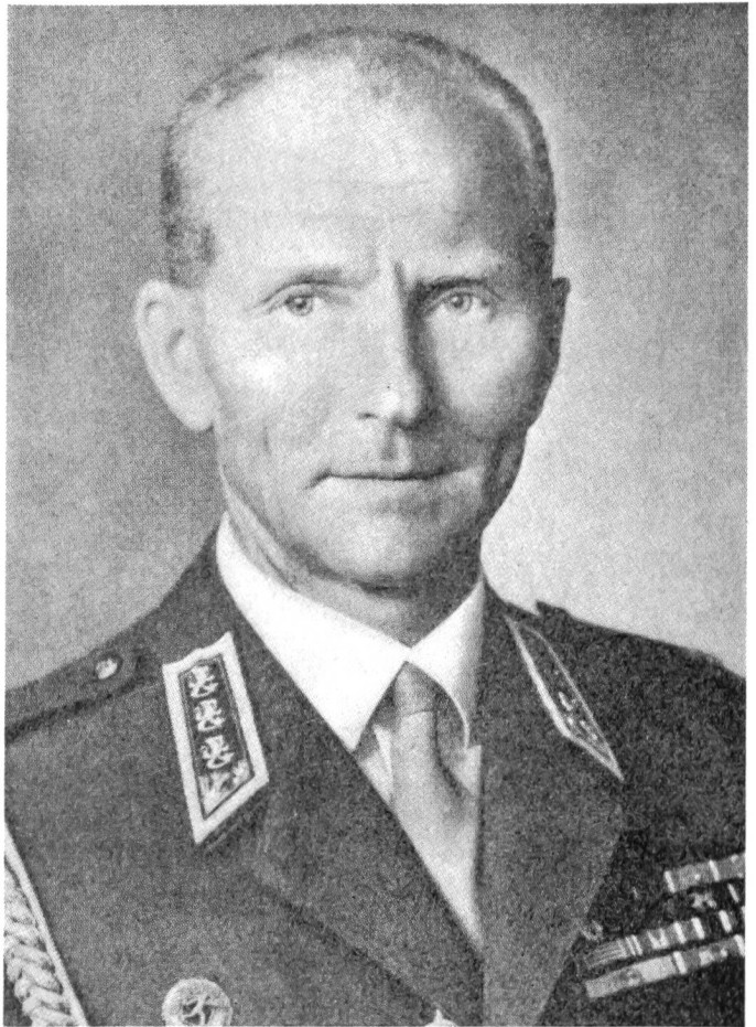
General der Infanterie Keinonen, Befehlshaber der finnischen Streitkräfte 1968

Die Armee setzt sich in Friedenszeiten aus folgenden Truppenverbänden zusammen: 7 Brigaden mit den Standorten Parola (Panzerbrigade), Uleaborg, Kajana, Säskylä, Dragsvik (schwedischsprachige Brigade), Kouvola und St. Michel; 9 Bataillone, verteilt auf Sodankylä (Lappländisches Jägerbat), Helsingfors (Jägerbat Nyland), Kontiolahti (Jägerbat Karelilien), Fredrikshamn (Jägerbat Kyme), Villmanstrand (Dragonerbat Nyland), Tavastehus (Jägerbat Häme), Lahtis (Dragoner-Jägerbat Häme), Obnäs (Küstenjägerbat) und Helsingfors (Gardebat); ferner: die Artillerieregimenter von Pohjanmaa, Satakunta und Karelilien, die Artilleriesektion der Nylands-Brigade und vier weitere Batterien. Dem Heer unterstellt sind auch die zwei Küstenartillerieregimenter von Abo und Sveaborg und die Batterien von Hangö, Kymnlinna und Vasa. Es sind ausserdem vorhanden: 1 Flabregiment, 4 Flabbatterien, 3 Pionierbataillone, 5 Nachrichtenkompanien, 5 Autokompanien, die Flottenstützpunkte von Abo und Helsingfors, zahlreiche Flugstützpunkte, eine See- und eine Luftkriegsschule sowie weitere kleinere Einheiten und Ausbildungsstätten. (Siehe Karte mit den Verlegungsorten der einzelnen Trupenteile!)