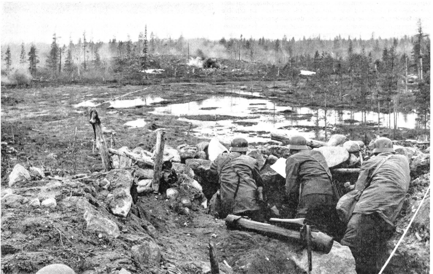
Dieses Bild zeigt deutlich das typisch finnische Kampfgebiet

Selbst als Bomber der Roten Luftwaffe finnische Ziele, und zwar ausnahmslos in Gebieten, wo keine deutschen Einheiten stationiert waren, angriffen, glaubte die finnische Regierung immer noch, ihre neutrale Stellung aufrechterhalten zu können. Erst drei Tage später, am 25. Juni 1941, erklärte Helsinki Moskau den Krieg. Entgegen Hitlers anmassender Rundfunkrede, in denen er