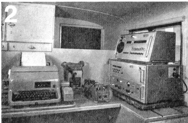
Zellweger AG., Uster/ZH Apparate- und Maschinenfabriken Uster