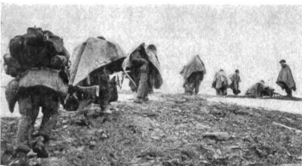
Schützen der «Queen's Own Rifles of Canada» gehen in Stellung