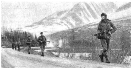
Ein Spähtrupp des Feindes nähert sich der kanadischen Stellung

war, bestand aus 100 Fahrzeugen und 700 Mann der «Queen's Own Rifles», die zusammen mit den anderen Verbänden vom kanadischen Generalmajor G. A. Turcot, Kommandeur der Europäischen Beweglichen Einsatzverbände, befehligt werden. Die Schiedsrichter und Beobachter des Gesamtmanövers waren höhere Offiziere aus zahlreichen Staaten. Die Durchführung oblag dem norwegischen General F. Zeiner Gundersen und die Gesamtleitung dem britischen General Sir Kenneth Darling. Für Kanadas schlagkräftige und schnelle Verbände bedeuteten diese Übungen zweifellos eine Vertiefung ihrer Kenntnisse, boten aber für die «allwettererfahrenen» Soldaten nichts Aussergewöhnliches, da sie an extreme Klimaverhältnisse gewöhnt sind. Tic