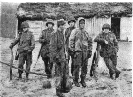
In der Kampfpause schnell ein Erinnerungsbild für sich und die zu Hause in Kanada