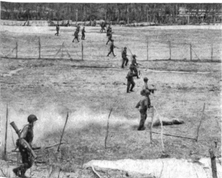
Kanadische Infanterie — bereits unter Beschuss — greift in Formation an