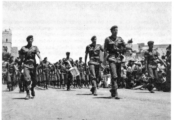
Unabhängigkeitstag in Jerusalem 1968