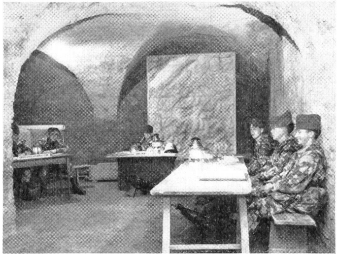
Im Nachrichtenbüro laufen die verschiedensten Meldungen ein, die vom Nachrichtenoffizier gesichtet, bewertet und verarbeitet werden.

Wenn der Funk bis heute dem Drahtnetz häufig nur überlagert war, um in ganz bestimmten Situationen und verhältnismässig kurzfristig das Basisnetz zu ergänzen und teilweise zu ersetzen, so muss doch heute im Rahmen der Atomkriegsführung das Funknetz oft parallel zum Drahtnetz betrieben werden können. Das Kabelmaterial der Infanterie wurde im Rahmen der TO 61 vollständig erneuert. Was für das Kabelmaterial bereits erfolgt ist, geschieht jetzt für die Kleinfunkgeräte der Infanterie. In der