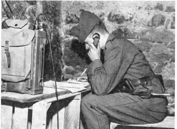
Bei jedem längeren Halt wird die Funkstation des Kampfgruppenkommandanten rasch aus dem Kommandowagen in einen sicheren Unterstand verbracht.

Hier setzt die Aufgabe des Übermittlers ein: Er hat einerseits die Meldungen und Nachrichten der unteren Kommandostellen rasch und sicher nach oben durchzugeben, um dem Kommandanten eine aktuelle und richtige Beurteilung der Lage zu erlauben,