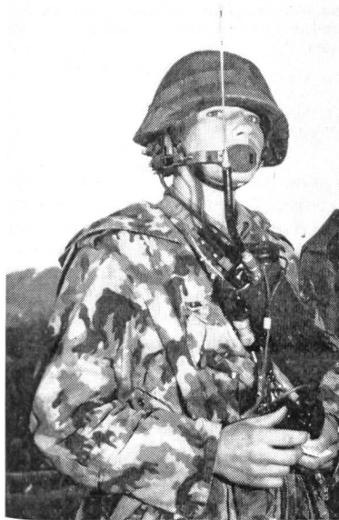
Überall wohin sich der Kampfgruppenkommandant bewegt, wird er von seinen Funkstationen begleitet. Damit wird die dauernde Verbindung zur vorgesetzten Kommandostelle und zu den Untergebenen gesichert.

Die Aufstellung einer Nachrichtenanlage, die richtige Standortwahl der gesamten übermittlungstechnischen Einrichtung, das frühzeitige Befehlen für den Einsatz der richtigen Übermittlungsmittel bedingen ein frühzeitiges Erkennen der Verbindungsbedürfnisse des Kommandanten, und diese Aufgabe wird der Kommandant nur einem Organ überlassen, das, diese taktische Absicht erkennend, die Übermittlungsmittel selbst fest in der Hand hält. Von Bedeutung ist eine wirklich kontinuierliche Auseinandersetzung mit der Entwicklung der Lage, eine nie abreisende gedankliche Durchdringung des Kampfverlaufes, um der Führung andauernd durch stete Anpassung des Befehls- und Nachrichtenapparates die Verbindung auf Anrieb sicherzustellen. Der Übermittlungsdienst der Infanterie bildet ein wichtiges Teilgebiet im gesamten Übermittlungsapparat der Armee und muss sich mit den infanteristischen Belangen und Erfordernissen voll decken.