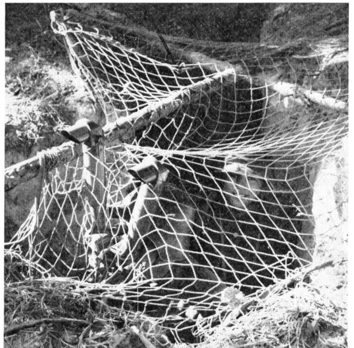
Eine weitverzweigte Beobachtungsorganisation, verbunden mit einem sicheren Übermittlungsnetz, liefert dem Nachrichtenoffizier einen Teil der dauernd notwendigen Bausteine zur Feindlagebeurteilung.

Zum Aufbau, Betrieb und Unterhalt dieses Befehls- und Nachrichtenapparates bedarf es einer Truppe, in der der letzte Mann fest davon überzeugt ist, dass nichts Selbstzweck ist, sondern dass er immer nur für den Kommandanten die Verbindung aufrechterhält. Neben der Betriebssicherheit des Gerätes und der im Einsatz vorhandenen Stromquellen ist der Mann, der es bedient, ausschlaggebend für den Erfolg. Die Eigenart des Übermittlungsdienstes der Infanterie und die Anforderungen, die an die Selbständigkeit des einzelnen Mannes ohne Kontrolle gestellt sind, erfordern unbedingt Zuverlässigkeit, körperliche Ausdauer, Pflichtgefühl in der Handhabung von Meldungen, geistige Regsamkeit in Verbindung mit dem technischen Verständnis. Für die Gewandtheit im Betriebsdienst und für das richtige Verhalten im Abwehrraum der Infanterie muss der Funker, Telefonist und Nachrichtensoldat selbst Infanterist sein. Für die Herstellung der Verbindungen im Kampfraum der Infanterie bedarf es neben dem technischen Können einer richtigen Beurteilung und Ausnützung des Geländes.