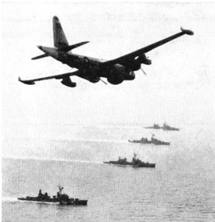
Ein von Sigonella (Sizilien) gestartetes U-Boot-Aufklärungsflugzeug P2 Neptune der Patrol Squadron 7 in Zusammenarbeit mit vier U-Boot-Abwehrzerstörern der 6. Flotte. Diese US-Maschine ist mit Torpedos, Raketen und Wasserbomben bewaffnet. Zurzeit werden die Neptunes durch die Lockheed Orion ersetzt.

Die Informationen über Aufklärungsergebnisse werden unter allen NATO-Ländern, die am Mittelmeer liegen, ausgetauscht. Umgekehrt wird auch von allen Mitarbeit verlangt, wenngleich Griechenland und die Türkei keine Flugzeuge stellen können und Frankreich auch hier die löbliche Ausnahme macht und nur gelegentlich eine Staffel zu gemeinsamen Manövern delegiert.