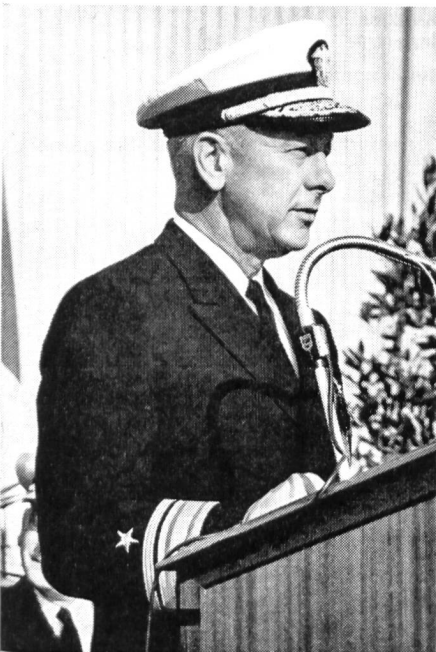
Konteradmiral Outlaw ist der erste Kommandant des neugeschaffenen NATO-Kommandos im Mittelmeer. Noch vor vier Jahren war er Kommandant der Flugzeugträgerflotte, die die ersten Angriffe gegen Nordvietnam startete.

Am 21. November 1968 wurden nun diese Einheiten organisatorisch zusammengefasst und einheitlich dem neuen NATO-Kommando «Aufklärungstreitkräfte Mittelmeer» (Maritime Air Forces, Mediterranean, kurz MARAIRMED genannt) unter dem US-Konteradmiral Outlaw in Neapel unterstellt.