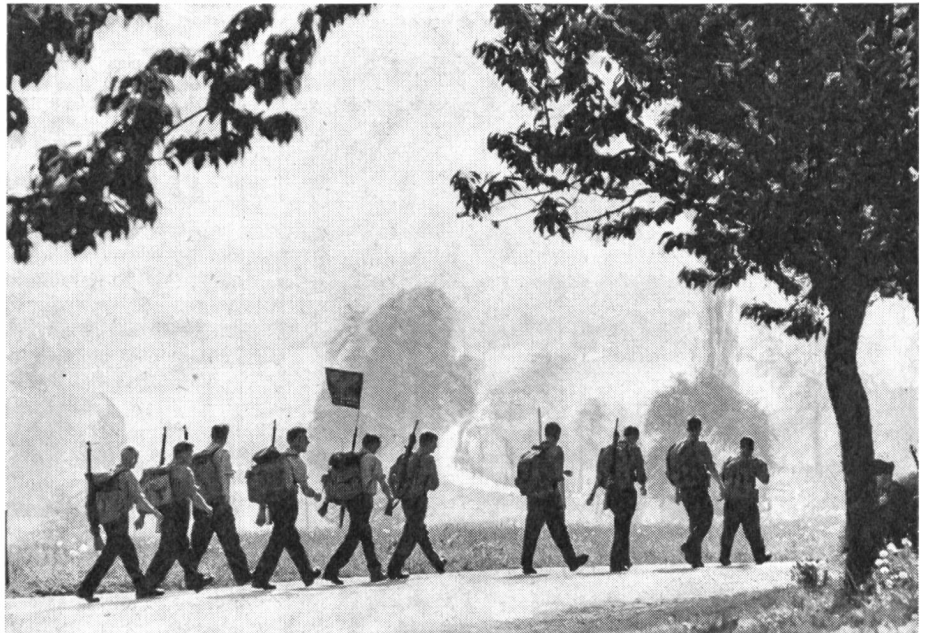
Marschgruppe der Militärkategorie unterwegs im Bernbiet

Unter dem Patronat des SUOV und organisiert vom UOV der Stadt Bern, war am 17./18. Mai dem 10. Schweizerischen Zwei-Tage-Marsch mit 9000 Teilnehmern in 1310 Gruppen aus 13 Nationen ein grosser Erfolg beschieden. Die Tatsache, dass der Chef des EMD, die beiden Präsidenten der eidgenössischen Räte, der Chef der Ausbildung der Armee, Oberstkorpskdt Pierre Hirschy, der Kdt des FAK 1, Oberstkorpskdt Roch de Diesbach, mit weiteren Oberstdivisionären und Oberstbrigadiers den Marsch besuchten, unterstreicht die Bedeutung dieses im Dienste der Marschtüchtigkeit und der Volksgesundheit stehenden Anlasses. Von Berner Seite erwähnen wir den scheidenden Militärdirektor des Kantons Bern, Stände- und Regierungsrat Dewet Buri, seinen Nachfolger im Amte, den Polizeidirektor des Kantons