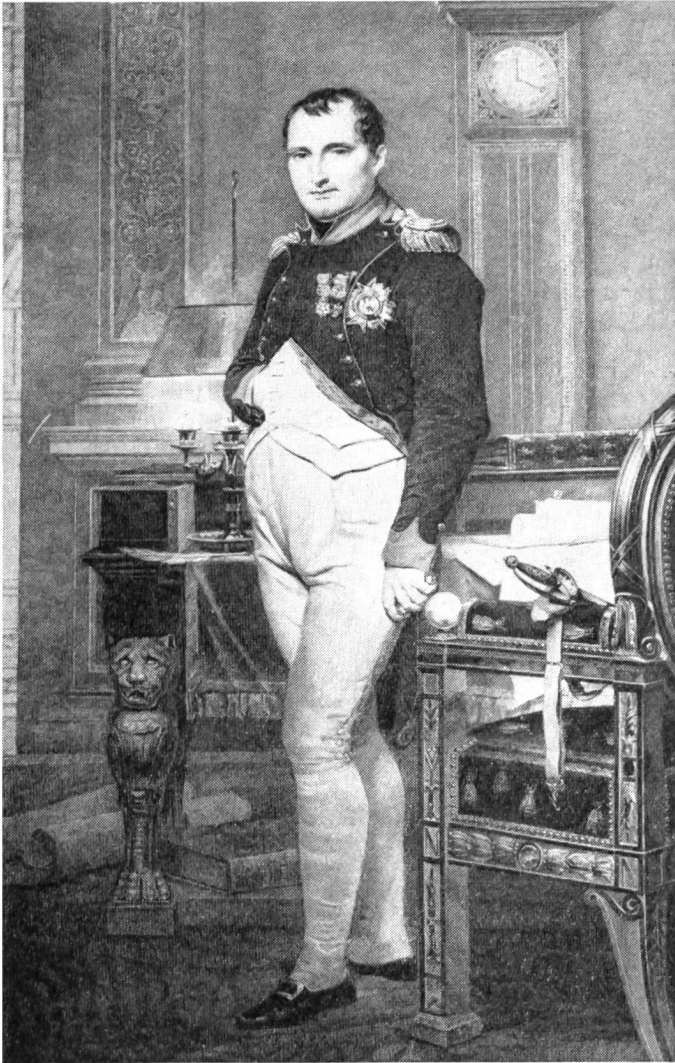
Kaiser Napoleon I., 1812 Nach einem Gemälde von L. David

«Soldaten, ich bin mit euch nicht zufrieden. Ihr habt weder Tapferkeit, noch Mannszucht, noch Beharrlichkeit gezeigt; keine Stellung konnte euch sammeln; ihr habt euch einem panischen Schreck hingegeben und euch aus Positionen treiben lassen, wo eine Handvoll tapferer Männer eine ganze Armee hätte aufhalten können. Soldaten des 39. und 85., ihr seid keine französischen Soldaten. Generalquartiermeister, es werde auf ihre Fahnen geschrieben: „Sie gehören nicht mehr zur Armee von Italien.“»