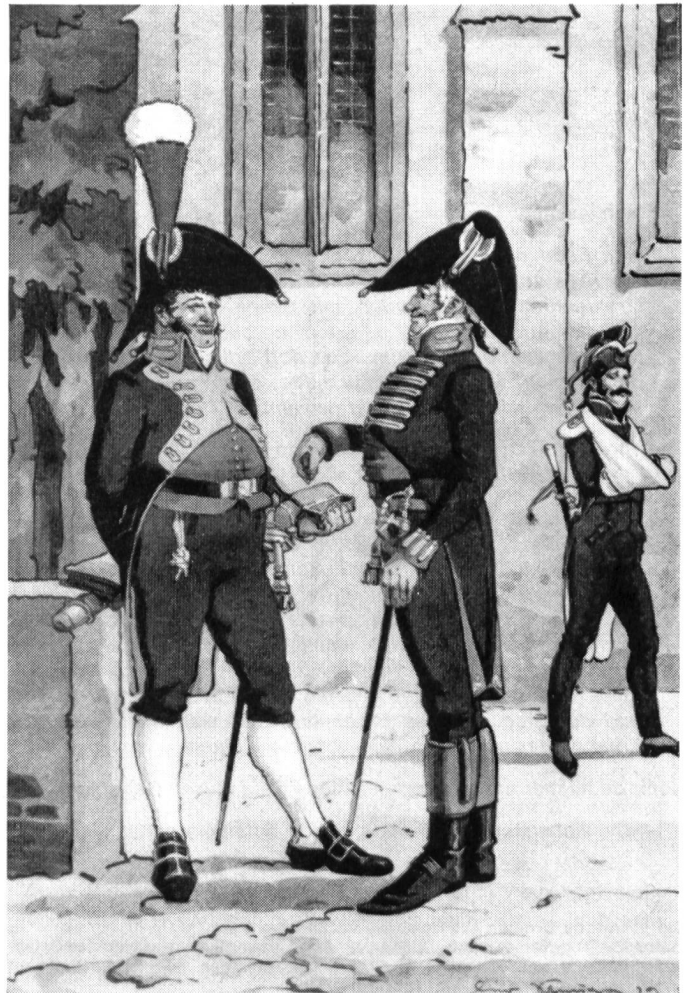
1804 Militär-Apotheker I. Klasse und Militär-Arzt I. Klasse

Der bedeutsamste und für kleine Geister vielleicht schwierigste der napoleonischen Führungsgrundsätze ist seine Einfachheit . Er sagte darüber: «Wenn ich eines Tages die Grundsätze der Kriegführung niederlegen sollte, wäre man über ihre Einfachheit erstaunt.» Diese Erkenntnis ist bei ihm immer anzutreffen: