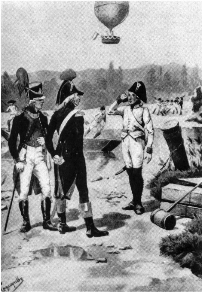
1800 Pontonier-Hauptmann Major der Luftschiffer-Abteilung Luftschiffer-Fourier