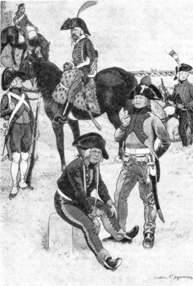
1800 3. Regiment Artillerie zu Fuss und 3. Regiment Artillerie zu Pferd Artillerist zu Pferd Artillerist zu Fuss Führer Hauptmann der Artillerie zu Pferd Trainsoldat Artillerist zu Pferd

geschlagen. Damit war der Zauberbann der Unbesiegbarkeit des Schlachtenkaisers gebrochen; die Verbündeten erhielten dadurch einen gewaltigen Aufschwung. Die Niederlage zwang Napoleon, mit den Resten seiner Armee den Rückzug an den Rhein anzutreten. Dabei hat er am 30. Oktober einen Versuch bayrischer Verbände, ihm bei Hanau den Weg zu verlegen, blutig abgewiesen. Mit 70 000 Mann überschritt Napoleon am 2. November 1813 bei Mainz den Rhein.