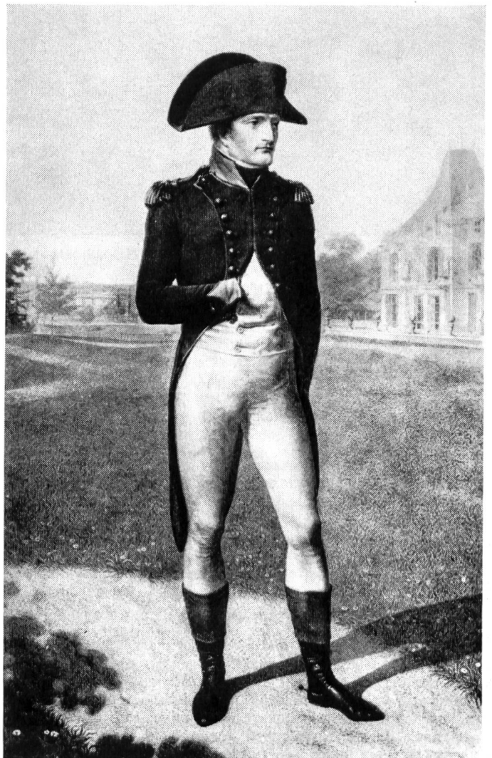
Napoleon Bonaparte, Erster Konsul, in Malmaison Nach einem Gemälde von J. B. Isabey Verlag W. Hugentobler, Schloss Arenenberg

Wie stark sich Napoleon schon damals fühlte und wie sehr er es sich leisten durfte, der Truppe ungeschminkt seine Meinung über ihre schlechten Leistungen zu sagen, zeigt eine Ansprache, die er vor der Schlacht bei Rivoli an die Truppe gehalten hat: