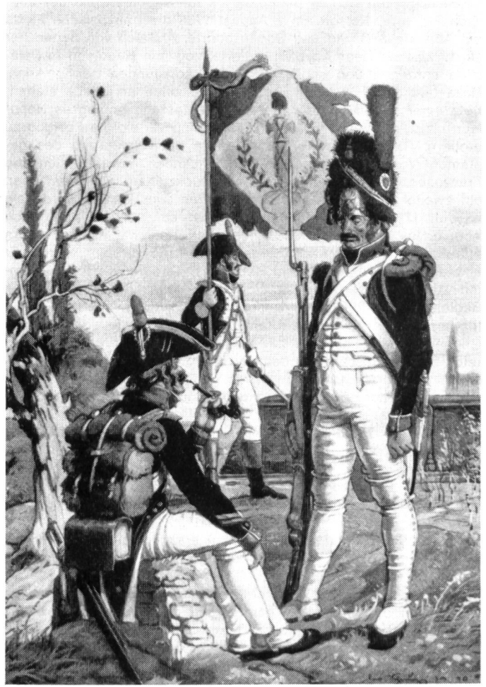
1800 Die Fahne der 1. Halb-Brigade in Strassburg Korporal Fähnrich Grenadier

Süddeutschland vorgehenden Heere der Verbündeten im Gebiet der Schweiz vereinigen und von hier aus in Frankreich einfallen.