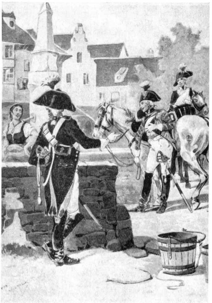
1803 Reiter und Trompeter des 10. Kavallerie-Regiments

Napoleon kannte die Seele seiner Truppe, darum fand er auch immer wieder den Ton, der ihr angemessen war und der Lage entsprach. Für ihn war das gesprochene Wort eine Waffe, die er mit vollendeter Meisterschaft handhabte. Seine Ansprachen, Aufrufe und Proklamationen an die Truppe sind, im richtigen Augenblick gesprochen, Meisterstücke der Truppenpsychologie. Diese Kunst des Umgangs mit Menschen ist eine eigenartige Mischung von Intuition und schlauer Berechnung — als bisweilen notwen-