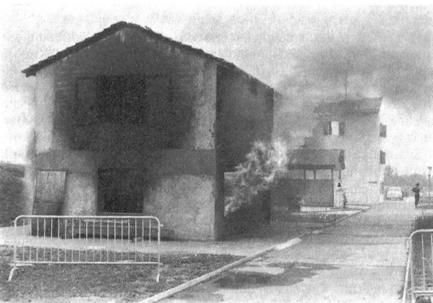
Das Brandhaus, wo das gesicherte Eindringen durch Feuer und Rauch und die Rettung von Menschen realistisch geübt wird.