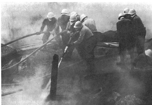
Während die brennenden und glimmenden Trümmer gelöscht werden, kommen auf Rettungsbrettern die ersten Verletzten zurück, um im Verwundeten-nest Erste Hilfe zu erhalten.

der Lage, in der Entschlussfassung und Befehlsgebung. Das Ausbildungszentrum dient der theoretischen und praktischen Ausbildung aller Dienste des Zivilschutzes. Ein Ausbildungszentrum setzt sich zusammen aus den Übungsstationen und Übungspisten, ergänzt durch die Bauten für den theoretischen Unterricht, Ver-