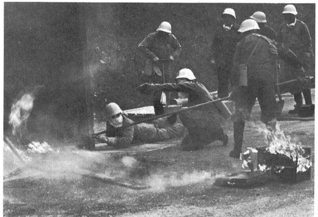
Mit kleinen Übungen im Brandhaus werden die Gebäudechefs und die Hauswehren ausgebildet.