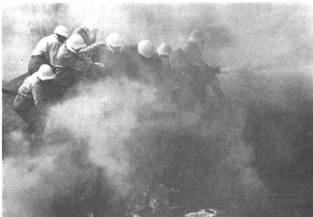
Was in der Armee der Feuerschutz ist, bezweckt beim Zivilschutz der Wasserschutz. Wasserwände und Wassergassen werden aufgebaut, um den Rettern das Vorgehen zur Bergung von Verschütteten und Verletzten zu ermöglichen. Es braucht viele kräftige Hände, um ein Strahlrohr unter vollem Druck zu halten und mit dem löschenden und schützenden Wasser voranzukommen.