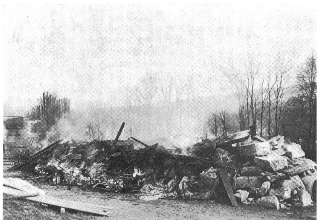
Das ist die sogenannte Trümmerpiste, auf der, durch Rauch, Feuer und Hitze vorgehend, kombinierte Einsätze durchexerziert werden.