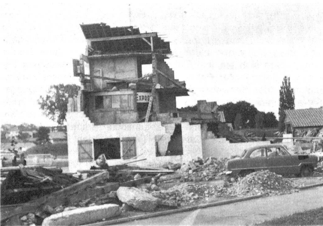
Das Trümmerhaus, wenn möglich an einer Trümmerstrasse stehend, gehört in dieser oder ähnlicher Form in jedes Ausbildungszentrum.