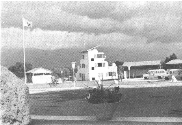
Übersicht des kantonalen Ausbildungszentrums der Genfer mit den Arbeitshallen und dem Übungsobjekt des Trümmerhauses.