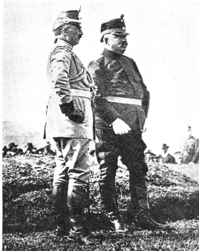
Kaiser Wilhelm II. und Oberstkörpskommandant (später General) Ulrich Wille auf dem Manöverfeld.

Nicht nur auf dem «Feldherrenhügel» (später von den Anwohnern noch lange «Kaiserhügel» genannt) drängten sich «riesige Menschenmengen» — auch übers ganze Manövergelände zerstreut wogten die Zuschauer hin und her. Sobald sich der Herrscher