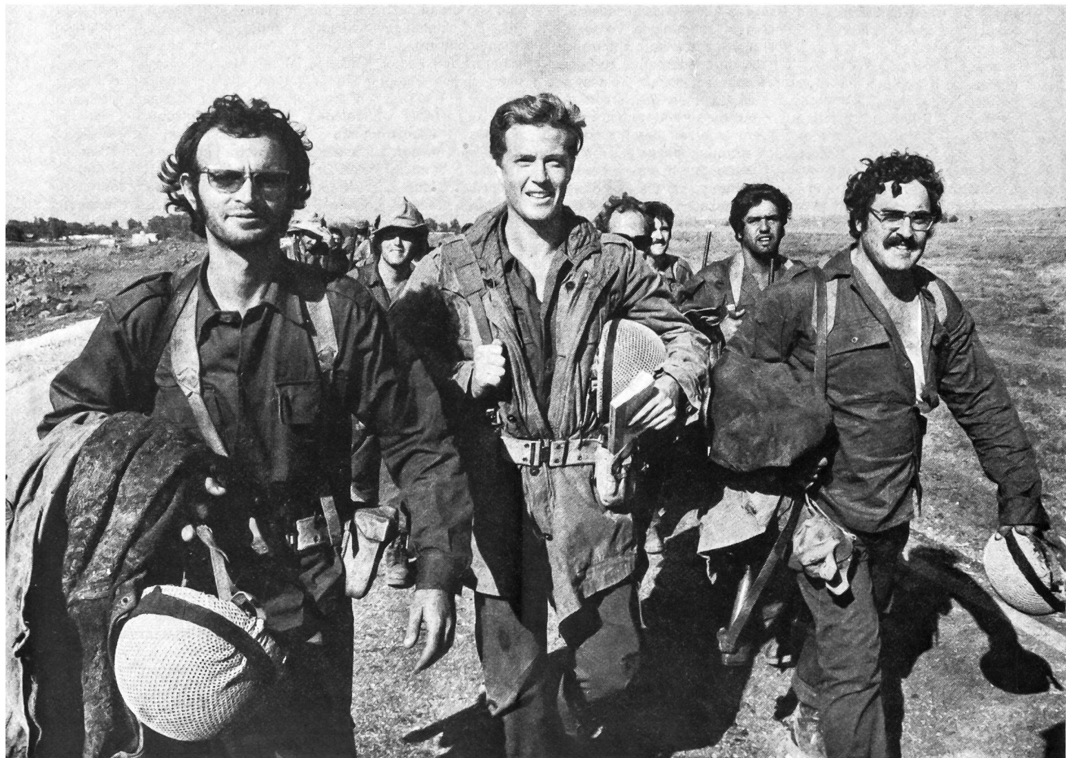
Israelische Reservisten an der syrischen Front.

Im Rückblick auf die vergangenen Oktobertage erkennt man die Richtigkeit des israelischen Begehrens nach sicheren Grenzen und versteht auch die hartnäckige Weigerung, sich von den Waffenstillstandslinien von 1967 zurückzuziehen, bevor ein wahrer, ehrlicher und dauerhafter Friede abgeschlossen ist. Ein an den Grenzen von 1948 mit der Übermacht von 1973 ausgelöster Angriff Ägyptens und Syriens hätte unter den Voraussetzungen vom Oktober den Krieg unweigerlich nach Israel hineingetragen. Er wäre unendlich viel blutiger und zerstörender gewesen und hätte die endgültige Auslöschung Israels bedeuten können, weil Zahal es im Gegensatz zu 1967 unterlassen hatte, mit einem Präventivschlag im letzten Augenblick dem drohenden arabischen Ansturm zuvorzukommen. Übrigens hat kein vernünftiger Mensch den arabischen Führern das postulierte Kriegsziel 1973: «Befreiung der von Israel besetzten Gebiete» zum Nennwert abgenommen. Wäre den Aggressoren in diesem Zweifrontenkrieg der erhoffte Durchbruch und der Stoss nach dem israelischen Kernland gelungen, hätten sie wohl kaum vor der Staatsgrenze angehalten.