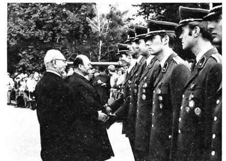
Bundespräsident Franz Jonas (mit Brille) und Verteidigungsminister Lütgendorf beglückwünschen die jüngsten Offiziere des österreichischen Bundesheeres zu ihrer Ausmusterung.

Verteidigungsminister Brigadier Lütgendorf, der an der Generalversammlung teilnahm, appellierte an den Korpsgeist der österreichischen Unteroffiziere und erklärte, dass die «Talfahrt» des Bundesheeres durch die Aufstockung des Budgets für 1973 teilweise gestoppt sei. J-n