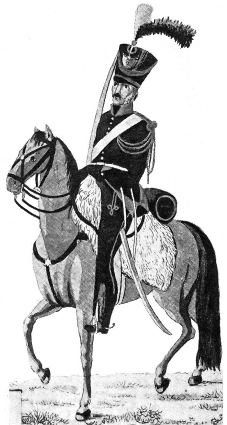
Alte Schweizer Uniformen 48

Es ist zu einfach, wenn heute der militärische Führer meint, er könne nun alle Unzulänglichkeiten der Kommission Oswald zuschreiben. Persönlich bin ich zwar mit dieser Kommission auch nicht in allen