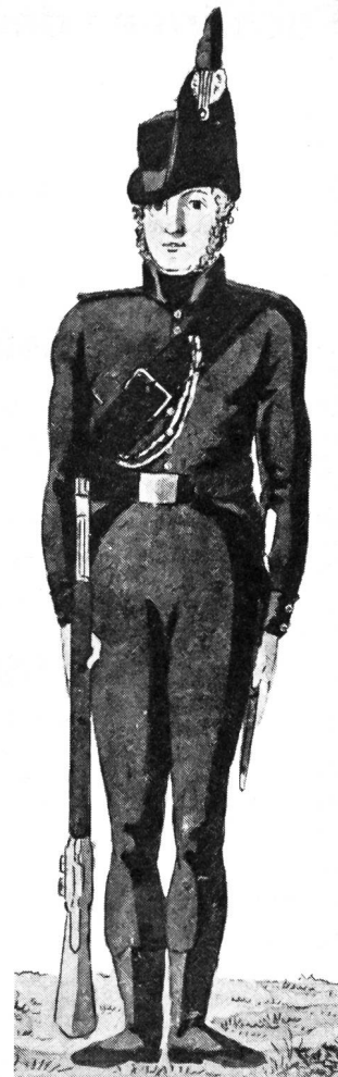
Alte Schweizer Uniformen 49