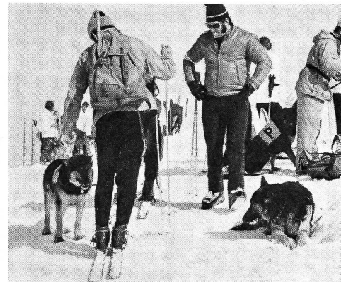
Gruppe der Berner Kantonspolizei mit ihren Lawinenhunden auf dem höchsten Punkt des ersten Marschtages, dem Gandlauenengrat.