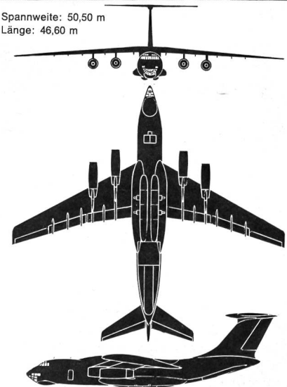
Transportflugzeug J 1-76 (NATO-Code: Candid)

4 Düsentriebwerke von je 12 000 kp Zuladung: etwa 40 t