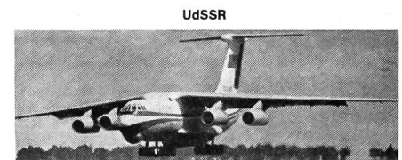
UdSSR Spannweite: 50,50 m Länge: 46,60 m