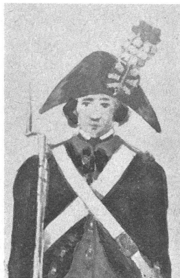
Zweispitz eines Füsiliers, 1792. Aus einem Aquarell von Paul Usteri, bezeichnet «Aus der alten Landschaft St. Gallen». Gänse gelb. Kokarde wellenförmig gefaltet, von unten nach oben: schwarz – gelb – schwarz – gelb – schwarz – gelb. Federbusch: unten weiss, oben rot. Ehemalige Sammlung Jenny-Squeder. (Vgl. auch «Schweizer Soldat» Nr. 7, 8 und 9 vom 15. und 31. Dezember 1967 sowie 15. Januar 1968.)