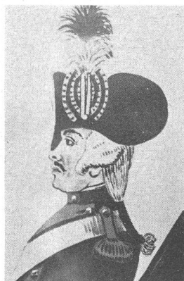
Zweispitz, 1792. Aus einem Aquarell von Marcus Heusler, bezeichnet «Zuziger von Abt St. Gallen. Ein Gemeiner vom ehemaligen Regiment Châteauvieux, jetzt von Compagnie Barthès vom Abt.» Kokarde: von innen gelb – schwarz – gelb – schwarz – gelb – schwarz. Federbusch: unten gelb, oben schwarz.