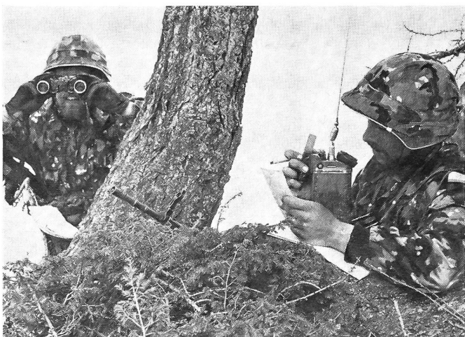
Der Zielbeobachter gibt die notwendigen Korrekturen an die Feuerleitstelle.