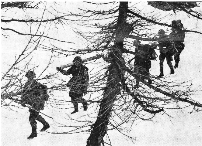
Stellungsbezug: von links nach rechts Geschützchef mit Grundplatte, Richter mit Rohr, Lader mit Lafette, Munitionsträger.