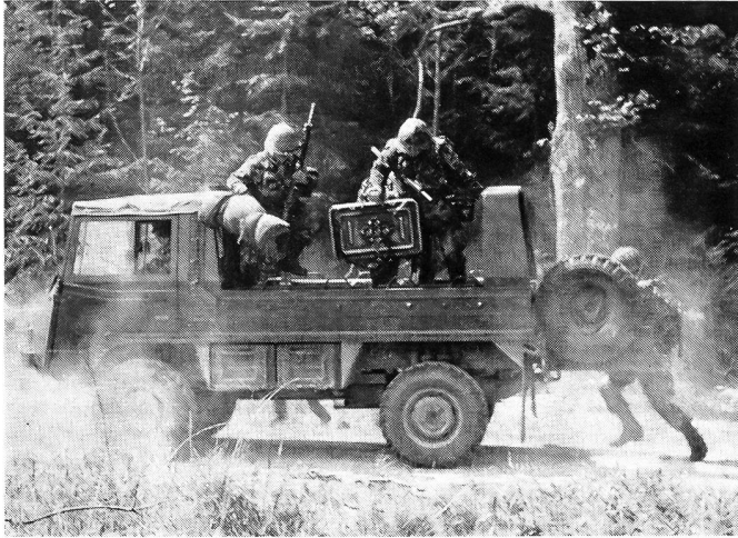
Die Werfermannschaft erreicht auf schnellstem Weg den Einsatzraum.