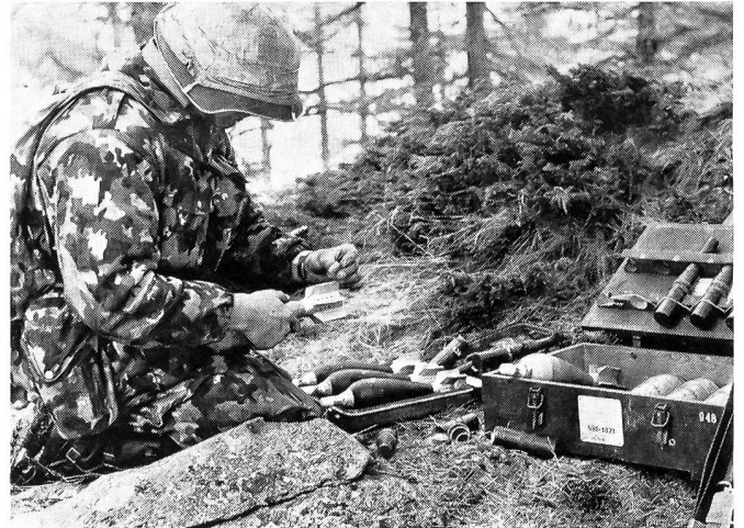
Anbringen einer Zusatzladung am Stabilisator.