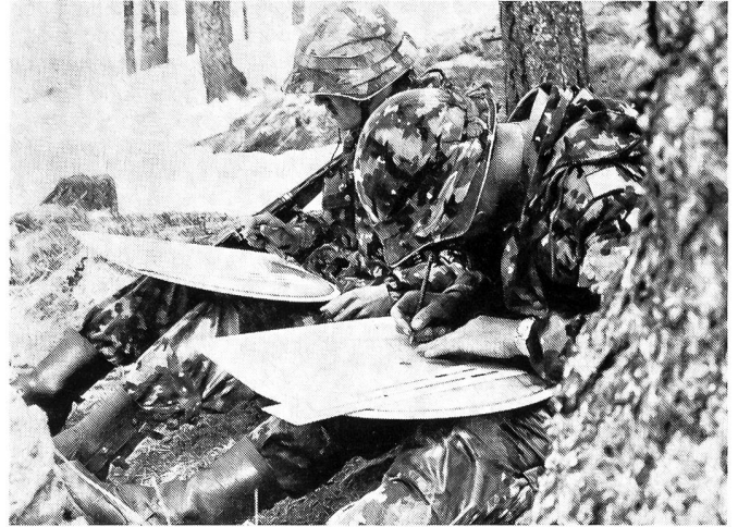
In der Feuerleitstelle werden die nötigen Angaben errechnet.