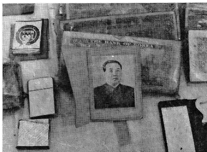
Ausrüstung eines nordkoreanischen Guerilla-Soldaten — alles ist südkoreanisch getarnt, nur das Bild von Kim Il-sung (Mitte) ist verräterisch.

Marinestreitkräfte erneut ein nordkoreanisches Guerilla-Schiff. Anfang Mai gelang es der Polizei, in der Nähe Pusans zwei Guerillas zu überwinden. Allein im letzten Juni scheinen drei Kommandos in Südkorea gelandet zu sein; teilweise flüchteten die Guerillas nach einem Feuergefecht — von den anderen hingegen hörte man nie wieder etwas. Ende desselben Monats kam es bei der Provinzhauptstadt Kwangju zu einer verbissenen Schiesserei, als sich zwei Guerillas entdeckt sahen. Anfang August wurde in den Bergen ein weiterer Guerilla erschossen. Mitte September konnte im Schutz der Dunkelheit bei einem einsamen Küstenstreifen ein nordkoreanisches Kommando an Land gehen, dessen Ziel augenscheinlich Sabotage an militärischen Einrichtungen war. Anfang Oktober vergangenen Jahres versenkten Marine und Luftwaffe Seouls im Gelben Meer erneut ein nordkoreanisches Guerilla-Schnellboot.