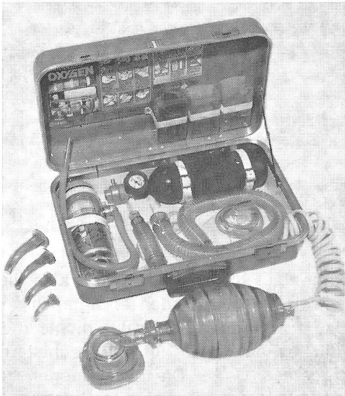
Erste-Hilfe-Koffer, Modell Modulaide Oxygen Jet