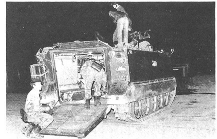
Der M-113 wird eingehend inspiziert.