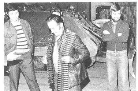
Ein Gurt der 12-mm-Munition zum Mg auf dem Schützenpanzer M-113.