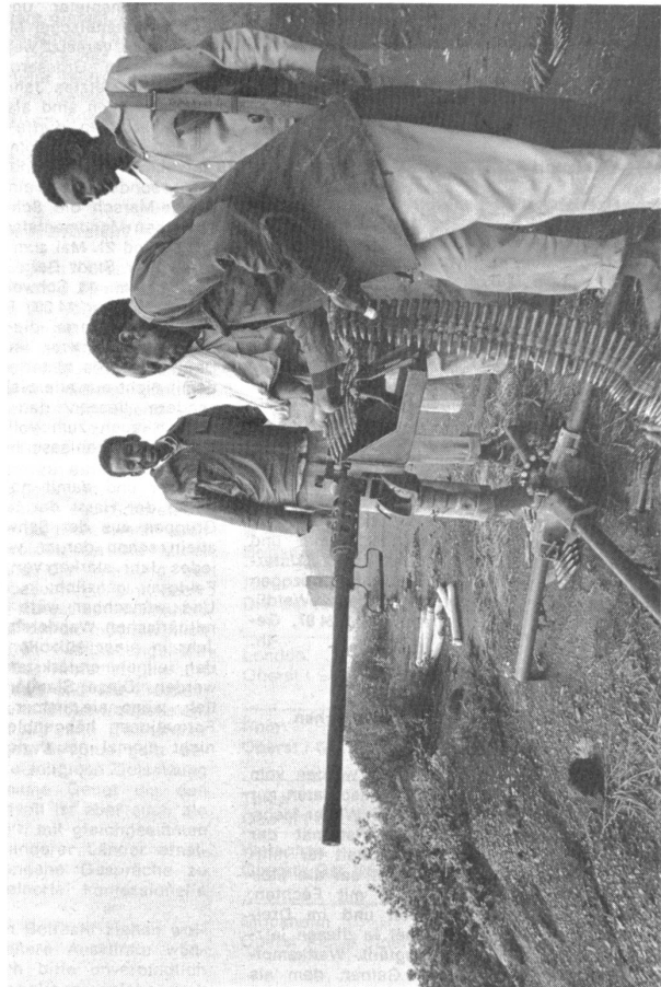
zwischen Äthiopiern und Somalis.