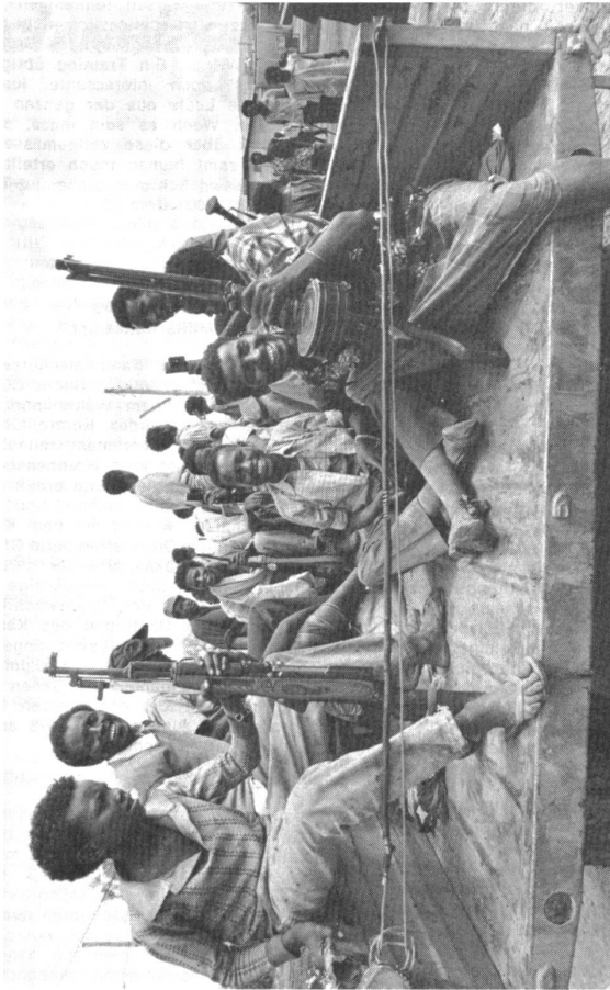
Mit erbeuteten sowjetischen Waffen ausgerüstete Soldaten der Befreiungsfront auf dem Weg ins Kampfgebiet.