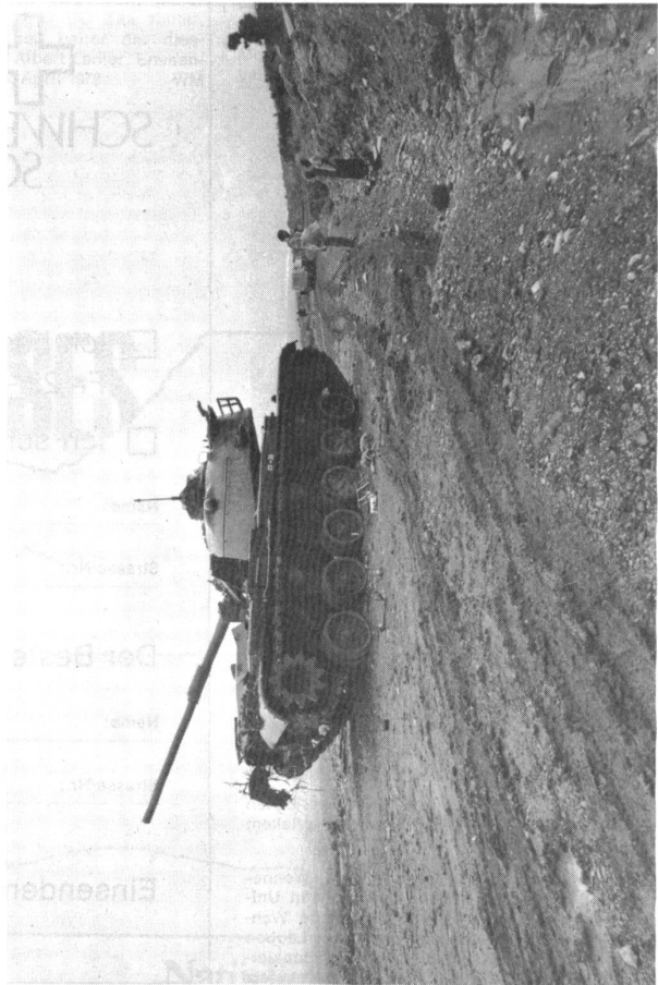
Erbeutetes sowjetisches Kriegsmaterial aus den jüngsten Kämpfen . . . . .