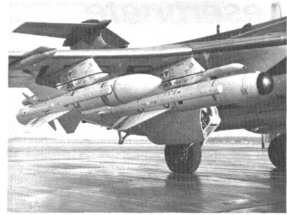
AJ.168 Martel an der inneren Flügelstation eines Tiefangriffsflugzeugs des Typs Buccaneer. Links im Bilde sehen wir einen für die Bekämpfung von Radarstationen ausgelegten Martel-Flugkörper der Ausführung AS37. (ADLG 12/77) ka