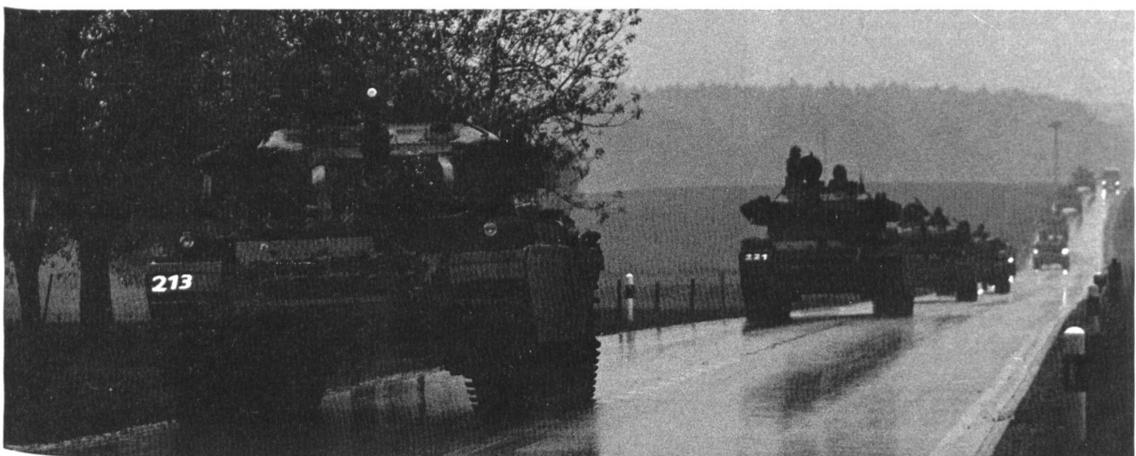
Panzermarsch im Regen