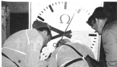
Die grosse Zeitmessuhr beim Start/Ziel des Skorelaufes.