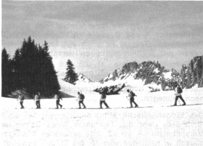
Schönster Lohn ist das Erlebnis der Kameradschaft in der Patrouille und das winterliche Hochgebirge des Obersimmentals an zwei herrlichen Vorfrühlingstagen. Ausblick von der Höhe des Jaunpasses.