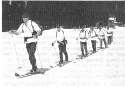
Eine der beiden flotten Patrouillen der britischen Rheinarmee, die in den letzten Jahren auch in der Patrouillenführung grosse Fortschritte gemacht hat.