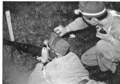
Leopard, Gepard oder? das ist hier die Frage.

Der Schaffhauser Nachtpatrouillenlauf, welcher bei vielen Sektionen der Nordostschweiz einen festen Platz in deren Arbeitsprogramm innehat, wurde einmal mehr vom UOV Schaffhausen in Zusammenarbeit mit der KOG Schaffhausen durchgeführt.