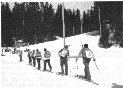
Die Patrouille 2 der EBT-Bahn im Aufstieg zum Jaunpass.