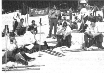
Schnappschuss vom Rastplatz auf dem Jaunpass.