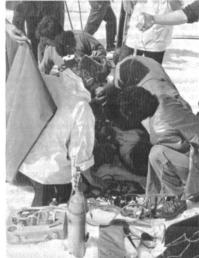
Ringens um das Leben eines Kameraden. Vier Ärzte und alle möglichen Einrichtungen, teilweise durch die Rettungsflugwacht herbeigeflogen, sind während Stunden im Einsatz — leider vergeblich.