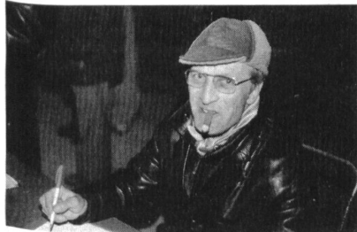
Einer von vielen Helfern, die es den Organisatoren ermöglichen, den Lauf alljährlich reibungslos durchzuführen.