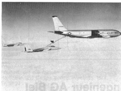
Allwetterabfang- und Luftüberlegenheitsjäger F-15 Eagle übernehmen Treibstoff von einem Tankflugzeug des Modells KC-135.