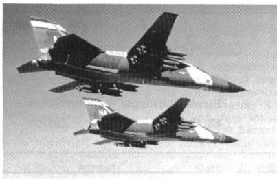
Bis zur Einführung des trinationalen Tornado-Waffensystems sind die zweistrahligten F-111 Schwefelkämpfer die einzigen allwetterkampffähigen Luftangriffsflugzeuge der NATO.