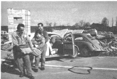
Zivilschutzleute bei der Ausbildung in der Kameradenhilfe.