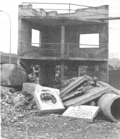
Übungsruine für die Bergung von Verletzten