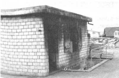
Übungsgebäude für Brandschutz und Brandwehr