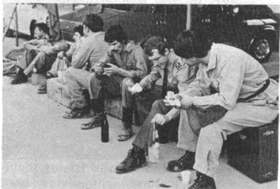
Der wärschafte Zvieri darf an einer Kaderübung nie fehlen.

Unlängst hat der UOV Untersee-Rhein eine Kaderübung in einer Kiesgrube der Umgebung Frauenfelds durchgeführt. Die Übungsleiter hatten ein anspruchsvolles Schiessprogramm ausgearbeitet. Die anwesenden Offiziere und Unteroffiziere hatten Gelegenheit, das neue Zielfernrohr-Sturm-gewehr ausgiebig zu testen. Jedermann war begeistert von der Treffsicherheit und Schnelligkeit der Waffe. Daneben wurde mit beiden Panzer-