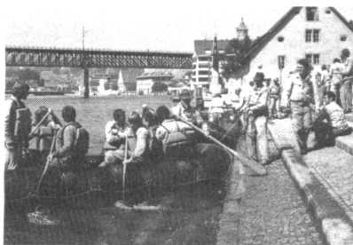
Ziel der Schlauchbootfahrt in Schaffhausen

Zirka fünfzig Mitglieder der Unteroffiziersvereine Frauenfeld und Wil sowie der Sektion Thurgau des Eidgenössischen Verbandes der Übermittlungstruppen nahmen über das Wochenende vom 19./20. August 1978 freiwillig an einer zweitägigen gemeinsamen Übung teil. Dabei hatten sie Gelegenheit, Geräte der Übermittlungstruppen und der Pontoniere kennenzulernen und praktisch damit zu arbeiten.