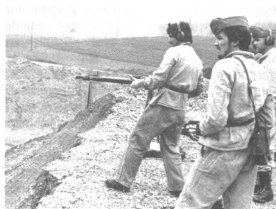
Mg-Schiessen aus dem Hüftanschlag

Die Panzerabwehr wird noch immer grossgeschrieben im Übungsprogramm der Unteroffiziersvereine, und so kann es nicht verwundern, dass eine ganze Kaderübung unter dieses Thema gestellt wurde. Die Aktivmitglieder des Unteroffiziersvereins Untersee und Rhein versammelten sich einmal mehr in «ihrer» Kiesgrube bei Weiningen, um im scharfen Schuss an den infantenistischen Panzerabwehrwaffen zu üben. Für Distanzen bis etwa 250 m kam das einfache und wirkungsvolle Raketenrohr zur Anwendung, während für die Nahdistanz bis etwa 70 m die Gewehrgranate mit Zusatzladung Verwendung fand. Unter der Anleitung der Übungsleiter wurden zuerst wieder die verschiedenen Bewegungen repetiert und anschliessend auf stehende Ziele geschossen, und dies mit bemerkenswerter Treffsicherheit. Daneben hatten die Teilnehmer aber auch Gelegenheit, mit dem Maschinengewehr der Schweizer Armee zu trainieren und zu schießen. Nach einer wohlverdienten Pause machten sich die Teilnehmer auf einen Patrouillenlauf in die nahen Wälder, wobei es an den verschiedenen Posten eigene und fremde Panzer zu erkennen galt. Zu den kartentechnischen Problemen gesellte sich hier auch das Überwinden von regensammem und sumpfigem Terrain.