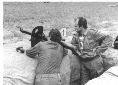
Deutsche Patrouille auf dem Gefechtsparcours

Thurgauischer Kantonaler Dreikampf vom 26. August 1978