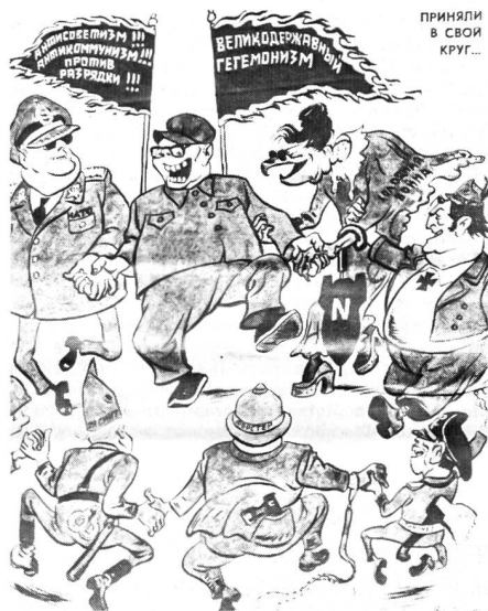
«In ihren Kreis aufgenommen», heisst diese Darstellung Chinas Verschwörung mit den «Reaktionären». Unter den Fahnen «Antikommunismus!!!» und «Grossmachthegemonie» tanzt der Chinese mit dem «Kalten Krieg» (Frauenfigur), «Strauss», «Pinochet», «Smith», «Forster» und «NATO» – mit Waffen-SS-Emblem (Krokodil, 25/78).