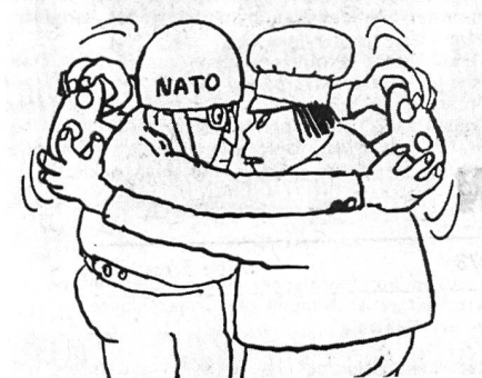
Diese ursprünglich aus Bulgarien stammende Zeichnung, die in der UdSSR verbreitet wurde, zeigt die Wechselbeziehung Peking-Westen.