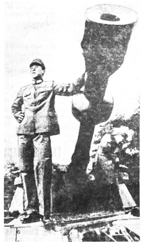
A & B. Solche aus der westlichen Presse übernommenen Bilder erschienen in allen Sowjetorganen.