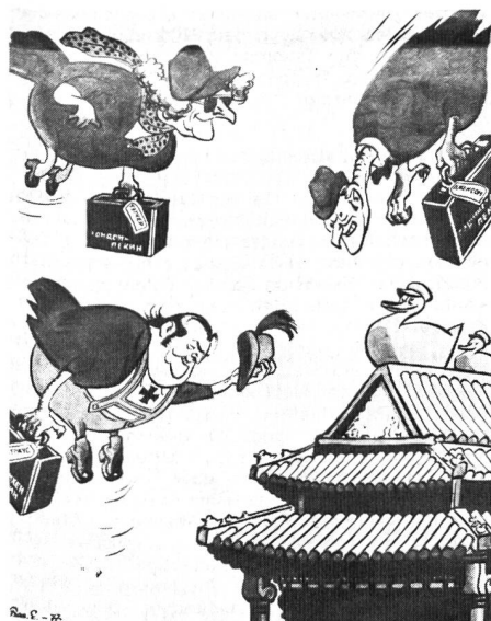
«Posttauben der Feinde der Entspannung.» Strauss, Thatcher, Jackson umwerben – profitsuchend, waffenliefernd? – Peking (Krokodil, 18/78).