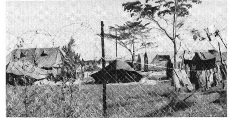
Bei Punta Gorda befindet sich die grösste britische Base in Belize (Bataillonsstärke). Ihre Aufgabe besteht darin, Belize vor der drohenden Invasion (?) Guatemalas zu schützen.