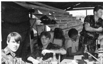
Als ich diese Aufnahme machte, waren die beiden schottischen Soldaten erst seit drei Tagen in Belize. Ihr Einsatz in der Kolonie dauert sechs Monate. Nicht sehr erbaut über das Auftauchen eines ausländischen Journalisten zeigte sich der bärbessige Korporal, rechts im Bild.