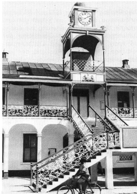
Das Rathaus von Belize-City vermittelt einen Eindruck von der eigenartigen Architektur dieser Stadt.

Hinter all dem antikolonialistischen und feindnachbarlichen Gerangel aber steht die Aussicht auf Erdöl: Die reichen Öllager der mexikanischen Halbinsel Yucatan ziehen sich bis zum Festlandsockel von Belize hin. An ihrer Ausbeutung sind die USA, England, Mexiko, Guatemala und nicht zuletzt auch Belize selbst interessiert. Als wir die Grenze in Richtung Guatemala passierten, stand auf der einen Seite auf einer grossen Tafel geschrieben: «Belize for the Belizeans», und auf der anderen Seite, nicht minder gross: «Belize es Guatemala» (Belize ist Guatemala). Zwei Länder, die schon von der Bevölkerungsstruktur her grundverschieden sind: Guatemala wird zu 70 Prozent von Indios bewohnt, während Belize von Kreolen und Karibiknegern bevölkert wird. Friedliche Menschen hier wie dort, die mit Verwunderung reagieren, wenn man sie auf den schwelenden Konflikt hinweist. Die Sorgen der Politiker sind nicht ihre Probleme!