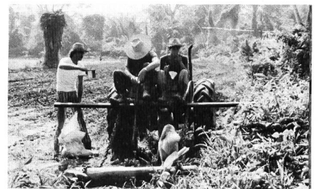
In Belize habe ich etliche Amerikaner und Schweizer getroffen, die auf dem billig erworbenen Land versuchen, die Erde zu bebauen. Ein schwieriges Unterfangen alleweil, wie auch Káru, Ferdinand und Evi (Bild) feststellen mussten.