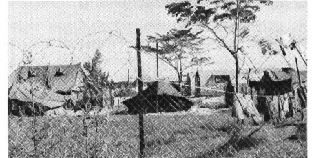
Bei Punta Gorda befindet sich die grösste britische Base in Belize (Bataillonsstärke). Ihre Aufgabe besteht darin, Belize vor der drohenden Invasion (?) Guatemalas zu schützen.