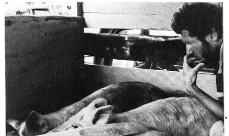
Eisenbahnen gibt es in Belize nicht. Der öffentliche Fernverkehr wird von klapprigen Autobussen bewältigt – zwischen Punta Gorda und Belize-City etwa dreimal in der Woche. So floriert das Auto-stopwesen: Wer Glück hat, erwischt einen Militärmilchcamion, wer Pech hat halt vielleicht einen Schweinetransport...