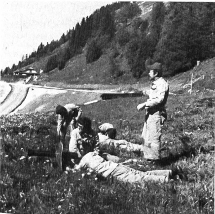
... und am Raketenrohr