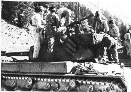
Jeder Teilnehmer konnte den Pz 61 im Detail kennenlernen.

Eindrückliche Kaderübung mit über 50 Teilnehmern